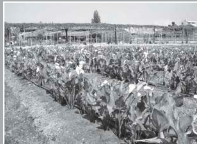
使用堆肥的海芋生長茂盛