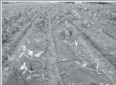
未使用堆肥區海芋缺株嚴重

本堆肥之特性主要在以木黴菌添加後，可將多醣類成分的纖維質，裂解成雙醣及單醣類的碳水化合物，如此可供堆肥製作過程中，中高溫分解菌（如放射線菌群及桿菌屬細菌）的利用，除可提高產品堆肥化過程中的核心溫度外，