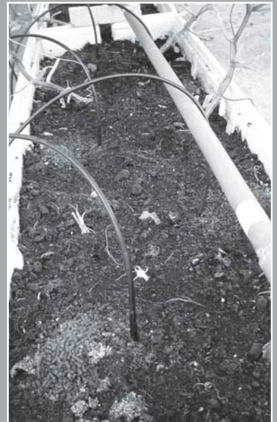
連作的介質影響作物發育