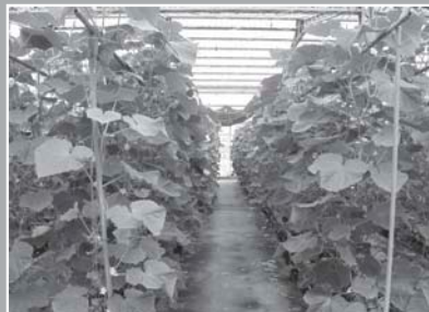
使用堆肥胡瓜生長良好