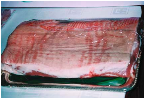
購買合法宰殺豬肉，為防疫盡一分心力

指標暨績效獎勵實施要點」規定，以獎勵主動、嚴懲不法等方式，雙管齊下落實疫情通報。另對於疑似口蹄疫病例必須迅速診斷，迅速處理，以防止疫情之擴散。