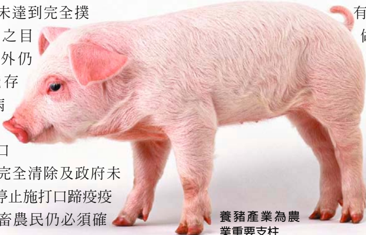
養豬產業為農業重要支柱

全面預防注射是撲滅計畫中最重要的一項措施，在撲滅計畫的第一階段所有養畜戶都必須確實做好預防注射及自衛防疫措施，並按月填交使用疫苗報告表，其所飼養動物拍賣或屠宰時均須繳交免疫證明書。對於未配合者，由各直轄市、縣（市）政府依動物傳染病防治條例處罰。另