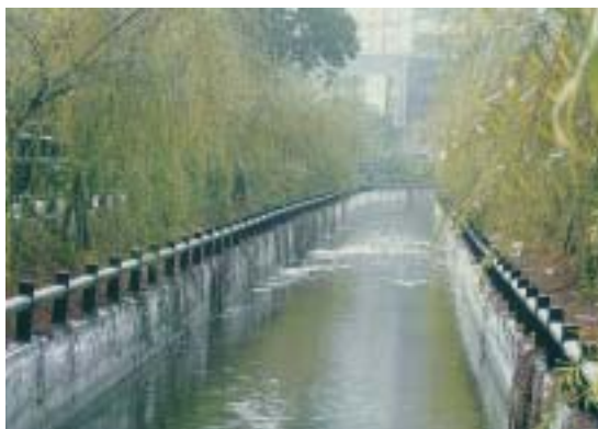
綠美化的水利設施

務推動。在這樣的理念之下，嘉南農田水利會，各項自籌收入自民國87年至93年6年來，已累計達63億3千5百餘萬元。