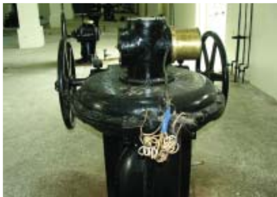
具歷史意義的農田水利文物

民國50年代以後，嘉南農田水利會因應現代灌溉排水管理需求，先後完成烏山頭水庫老舊放水設施改善工程、南北幹線