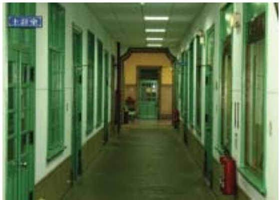
嘉南農田水利會主體建築是一座古蹟

嘉南地區早期所設土渠及內面工水路，泰半破損不堪使用，堤岸水利地常被侵占、濫墾、侵耕，導致草木繁生，髒亂不堪，不但有損田園景觀，亦降低居民生活品質，且嚴重影響圳路灌溉排水功能。為此，徐會長帶領嘉南水利會同仁推行圳路綠美化工作，於辦理圳路更新改善的同時，一併辦理綠美化。經由各工作站利用各種公共場合加強宣導，以柔性勸導取代強力執行，並取得社區居民的認同，將圳路綠美化視為社區重要之工作，共同將堤岸水利地之雜物、絲瓜棚、竹木等拆除淨空，以利更