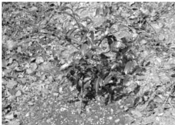
定植3個月後的茶苗可考慮少量施用緩效性高的肥料

肥培效益主要是檢驗外施養分進入樹體的多寡，並表現在茶菁收穫上。茶業改良場研究發現，春茶生產時，葉層與根群的養分會大量移入茶菁；但冬茶生產時，主要依靠葉層及細枝，也就是離茶菁較近植物組織的養分才會大量移入茶菁。由於母葉在春、冬茶均扮演重要角色，且冬茶生產後的葉層再增加能力有限，故如何在夏季培養接續冬、春茶生產時的健康母葉層，成爲夏季葉層經營的重點。因此理想中的茶園管理是追求創造一個春茶萌芽前樹體氮含量