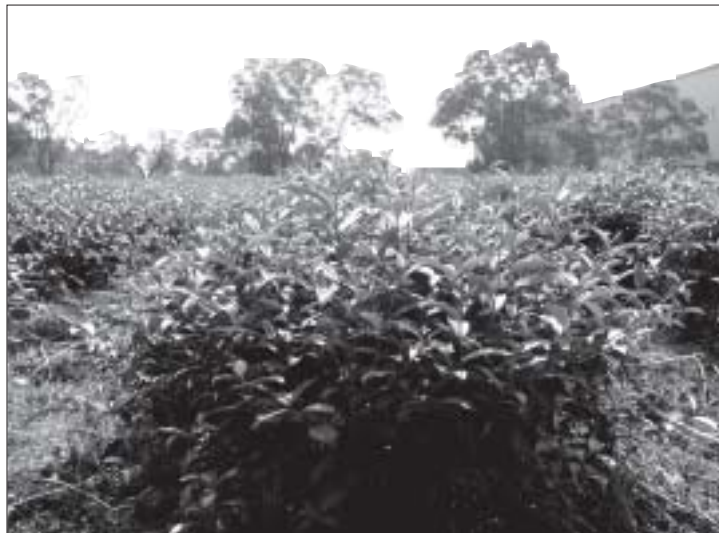
適度控制施肥量並於春茶生長後進行中剪，以重新培養樹冠的茶園

測，為避免後續大雨造成肥料流失，施肥仍應以少量多次施用為主。前面提到根群會受到礦物養分的吸引而改變生長方向，所以基肥最好以靠近樹冠施用並予翻耕入土，而追肥以樹冠內側撒施為主，除直接避免日曬雨淋外，並可誘引根系在此範圍