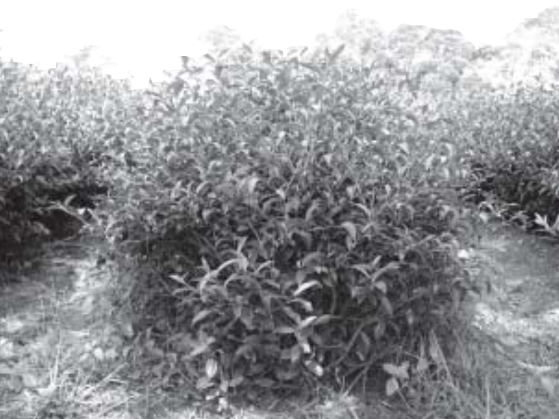
未控制施肥量又放任夏梢自然生長的茶園

肥料到底要施在那裡才能發揮最大的經濟效益？首先施肥的目的是供給茶樹生長所需，故園主必須在自身茶園中尋找根系的分佈，以為未來精準施肥做準備。一旦肥料進入土壤後，各元素主要是藉溶於水後才進行縱、橫向的移動，其中橫向移動距離較為有限。目前已有部分農友施用基肥時不再翻耕，追肥時則乘著雨後大量施用。但因天候難