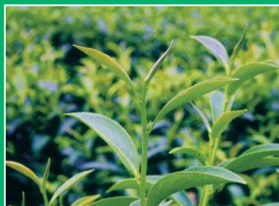
允芳茶園的小葉種青心烏龍茶