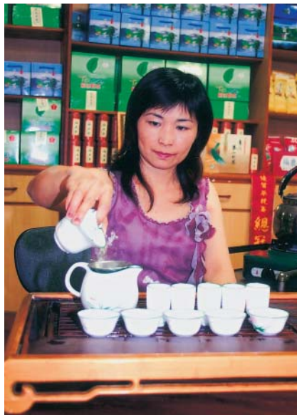
福鹿茶廣受茶藝界人士鍾愛

福鹿茶區為花東地區栽培面積最大的茶區，總面積約400多公頃，主要分佈於鹿野鄉永安村、龍田村、延平鄉永康村及鹿野台地與中央山脈山坡地，海拔高度從300多公尺爬升至950公尺，茶區裡設有多處觀景亭，登高眺望鹿野及延平一帶的田園風光，盡收眼底；西側是峰峰相連的中央山脈，東側為形似臥佛側影的都蘭山，南方則是開啓國內少棒風潮的布農部落—紅葉村。巍峨壯麗