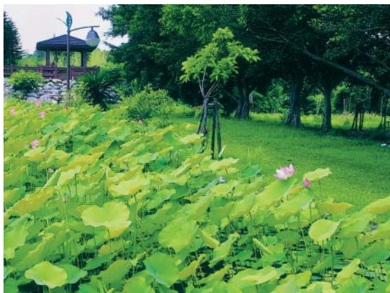
允芳茶園設有觀景亭