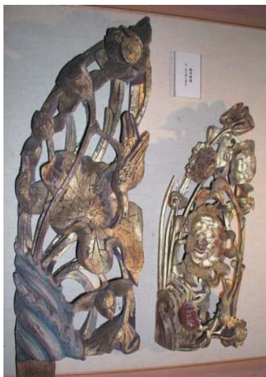
蓮花資訊館收藏古代狀元宅屋頂下樑柱的蓮花並蒂木雕裝飾

白河鎮的蓮花田多集中於玉豐、廣安、詔安、大竹、蓮潭等五里，其中，蓮潭里的蓮田佔地最廣，夏天到白河遊覽，蓮花走到哪看到哪。除了著名的蓮花大街集中的蓮田外，今年也規劃單車之旅，讓遊客騎單車探險，離開人潮擁擠之處，彎進蜿