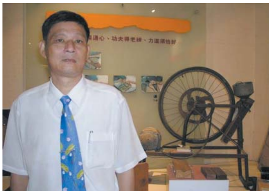
蓮花資訊館展示早期農家生產蓮子的器具