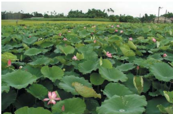
蓮田、稻田、農舍與藍天，白河「蓮之鄉」雅號名不虛傳

台 南縣是阿扁總統的故鄉，也是蓮花的故鄉。10年前，白河鎮已蓮田遍布，蓮花隨著季節花開花落。但看慣蓮葉田田的古意農民，卻沒想到，有朝一日，那綠葉紅花的幫襯，竟如魔力般，為農村與蓮子鍍了金。每年蓮花節舉辦期間，為白河鎮帶來2億5千萬元的驚人產值，「蓮之鄉」名聲全台響叮噠。而創造農村神話