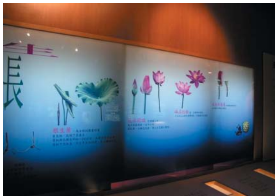
走一趟蓮花資訊館，蓮花生長過程盡入眼底

鎮，但像白河鎮將全鎮規劃成爲一座大型休閒園區，成功營造鮮明意象的鄉鎮並不多。從入口意象開始，偌大的蓮花標誌歡迎著南來北往的旅客蒞臨，轄區從蓮花公園到獨一無二的蓮花資訊館，在在顯示出小鎮行銷蓮鄉風情的用心。