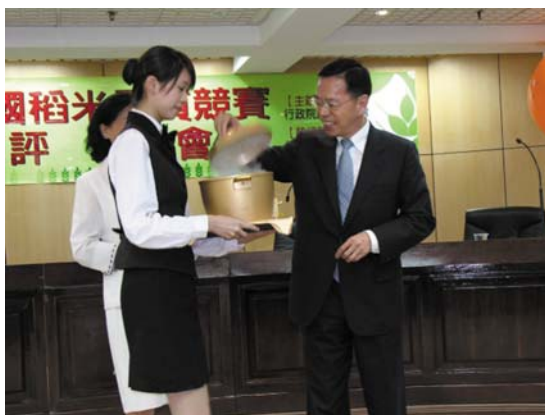
李主委從金電鍋中取出冠軍名單

當農委會李金龍主任委員親自揭曉「2005年全國冠軍米王」，由來自台東縣池上鄉林龍星農友奪得冠軍寶座時，現場歡聲雷動，來自池上的鄉親彷彿是自己得獎似的，熱烈的掌聲與熱情的歡呼久久無法停息。而早已聲名遠播的池上米，此次