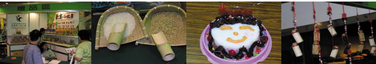
秋季新米展售會風情萬種

近年來由於國人生活水準大幅提升，對於稻米的品質也愈來愈重視，目前，每公斤35元左右的平價食米雖仍佔有國內大部分市場，惟近年來高品質稻米的宣導訊息，已令許多講究飲食的國人接納，故選購每公斤 100 元以上優質台灣米的風潮已逐漸形成，是造成本次優質新米展售活動受到民眾熱烈反應的主因。