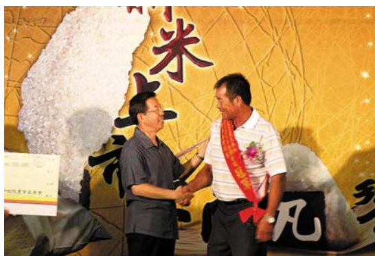
行政院謝院長為冠軍米王披上彩帶