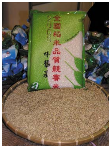
本屆冠軍米是台梗2號

本次活動在愛護台灣農業的各界人士的支持下，以實質購買行動來支持台灣稻米的永續發展，讓稻農的辛勞獲得了極高的迴響與回饋，激勵提升台灣稻米品質及強化行銷工作，也藉此希望國內消費大眾付諸行動支持優質台灣米。