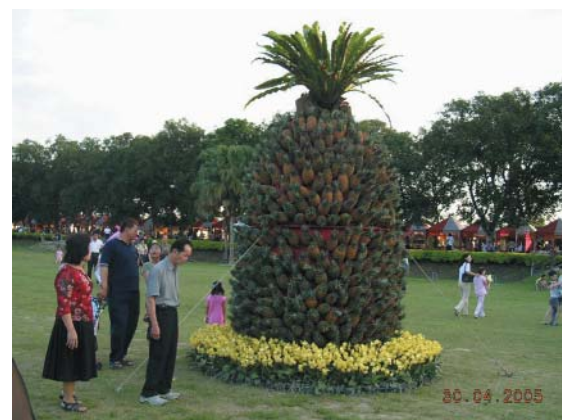
鳳梨及農特產品展售活動

況且中國大陸片面給予台灣水果零關稅優惠，倘能將檢疫、通關便捷化、原產地證明等配套措施有所安排，對台灣水果銷往中國大陸應較有幫助。中國大陸目前對於實施台灣水果零關稅之期