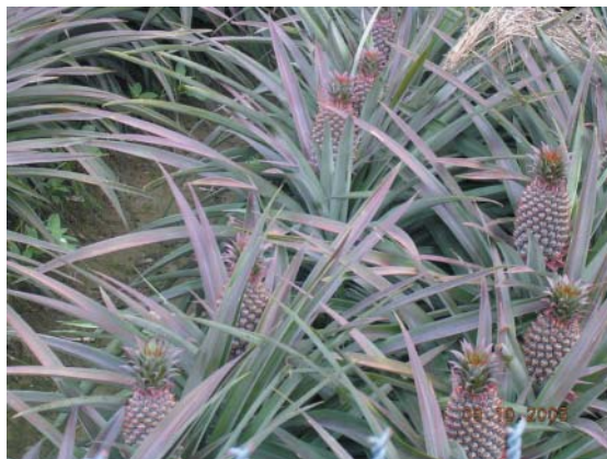
鳳梨為台灣重要經濟果樹

果菜生產合作社配合雲林縣政府農業局促銷農特產品，曾經於4月29日起連續3天在古坑綠色隧道舉辦「蘭花香、咖啡情、旺旺來」鳳梨及農特產品展售等活動，主辦單位準備約3千台斤的鳳梨，在綠色隧道公園草皮上，布置成高達3公尺的超級大鳳梨，頭座是以山蘇布置綠葉，基座則以黃色蝴蝶蘭環繞，吸引遊客的注意與興趣，宣傳效果十足。