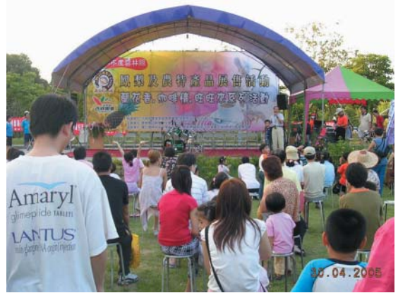
配合活動提高商機

鳳梨以輸日占大宗，開放零關稅優惠後，增加鳳梨銷大陸誘因，大陸增加台灣鳳梨採購量後，外銷市場規模擴大，短期內價格會持續上漲；但農民宜審慎面對，農產品行銷國際，應分散風險，不宜將大陸當成唯一市場盲目擴增面積，萬一關稅突然調漲或條件變嚴苛，農民將蒙受損失。鳳梨目前價格雖上漲，農業單位憂心生產過剩，請農友勿盲目搶種，免得產銷失衡，價格下跌吃虧。