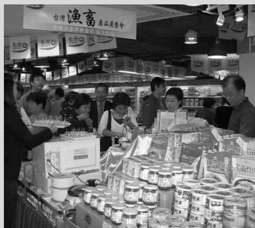
香港永安百貨台灣漁畜產品展售會反應熱烈