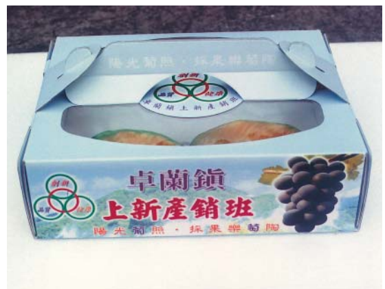
包裝透明化，品質看得見

展望未來，楊桃產銷第一班希望全班整體培植技術層面有新的突破，研發出特優品種，使品質提昇至更高層次，行銷方面更多元化，開拓更大的外銷市場，產銷合一，減少中介環節，以合理的價位讓消費大眾吃到安全優質的水果。🍇