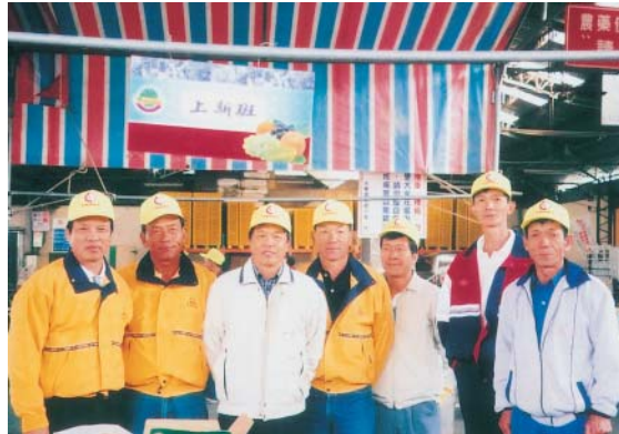
班員參與展售活動