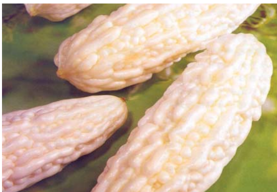
讓消費者吃的安心

陳列販售之蔬果以吉園圃者為限，品項至少8種，並確實依規定標示有吉園圃標章；且經營者均接受農糧署、各縣（市）政府等單位不定期至各專區抽查，並依輔導進行改進。