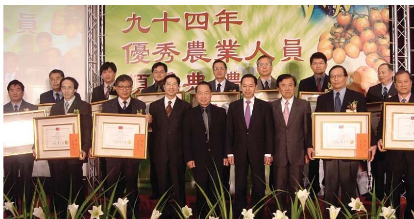
全體得獎人員與主委合影