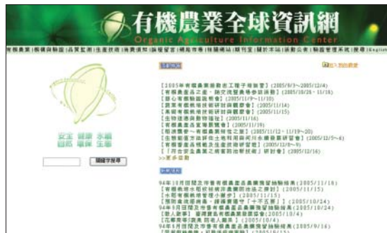
有機農業全球資訊網