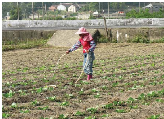
有機農業強調生產過程

有 機農業在世界各國又有稱生態農業、永續農業、自然農法等，是一種遵照有機農業生產標準，在生產過程中不採用基因工程生物及其產物，不使用人工合成的農藥、化學肥料、生長調節劑、飼料添加劑等化學物質，根據自然法則和生態學原理，採取包括選用抗性作物品種，建立合理的耕作體系，利用農場廢棄物循環利用、輪作、種植綠肥和完全腐熟堆肥等措施培肥土壤，利用生物多樣性和物理的農業措施控制病蟲草害，選擇合理的在農地工作措施防止水土流失等可持續技術，協調環境體系平衡，建立可維持農業生態系統持續穩定的生產模式。這種生產模式是爲了使空氣、土壤和水的污染最小化。