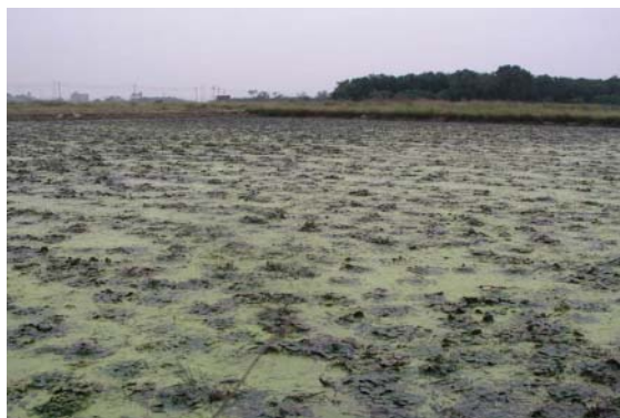
採收近尾聲的菱角田