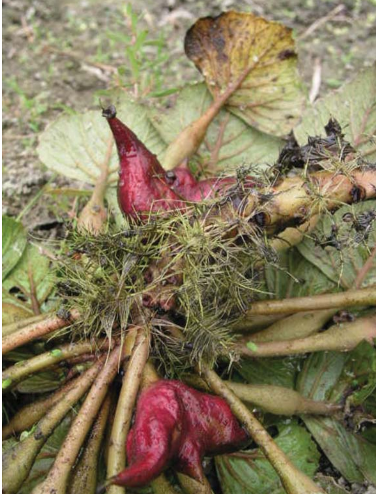
菱角對生的結果方式在植物學上並不多見

複，但保留菱角紋路的吊飾，加上外觀宛如元寶，有招財進寶的吉祥意涵，深受遊客喜愛。為了紀念種種辛苦的過程，官田鄉農會特地取名為「菱藝傳奇」。