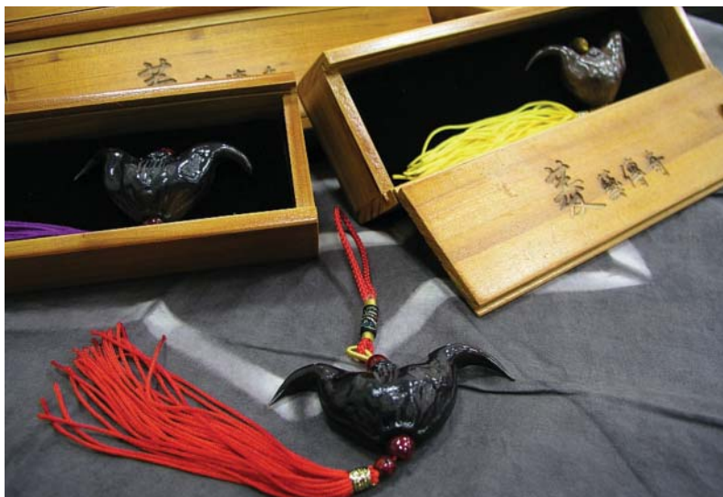
菱角殼廢物利用做成的吊飾，保留原味的農產特色，是台南縣府贈送貴賓的好伴手