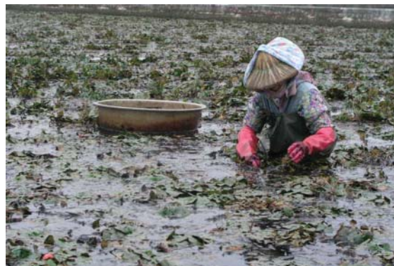
趕著午時結束前，農婦下田採收菱角

物，但卻是全國知名度最高的農業，也是林正容掌舵的農會重點發展產品。從菱角殼到果肉，從田地利用到作物管理，官田鄉農會對每個環節都不放鬆，尤其台灣開放大陸人士觀光在即，林正容看準龐大商機，訂定加強菱角養生加工研發與推動休閒產業的經營目標。