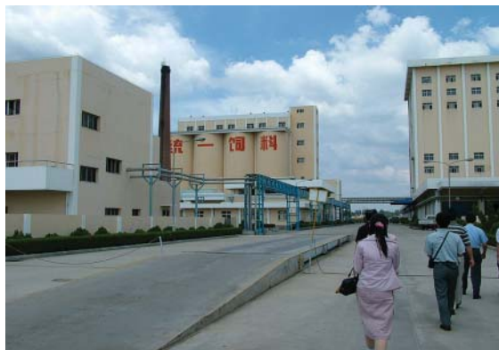
參觀台商農企業之一－青島統一飼料廠

接著來到了青島平度市北部的大澤山鎮，大澤山葡萄有悠久的栽培歷史，全鎮葡萄栽培面積現已達到3萬畝，擁有國內外優質品種300多種，年產量約5,000萬公斤，1994年在「全國百家特產之鄉」評選中，大澤山被評爲全國的「中國葡萄之鄉」，該鎮目前也開始迎合觀光農業的潮流，配合四週的壯麗景觀搭建了觀景涼亭等設施，