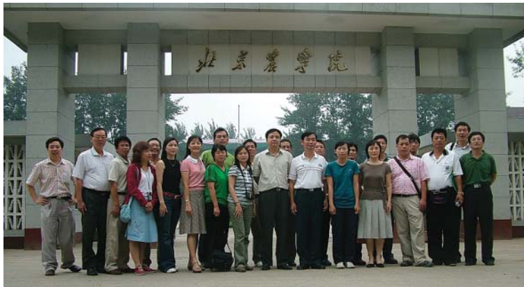
北京農學院－研討會後一行人在北京農學院合影留念

94年8月隨同屏東科技大學大陸農企業管理研究所赴中國華北地區考察，在段兆麟教授的悉心規劃與安排下，我們除了遊歷了故宮與長城等歷史景點，也參訪了許多的休閒農業據點，對於大陸的發展現況與農業環境留下深刻印象，以下便針對這次考察走訪的幾個地區所見與心得作詳實的紀錄。