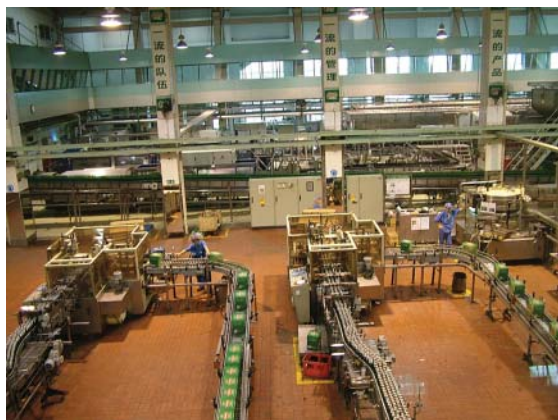
青島啤酒廠－參觀聞名全世界的青島啤酒製造過程

來到章丘黃河鄉萬畝生態農業示範園區，黃河鄉萬畝生態農業示範區位於黃河邊緣，總面積18,000畝(1,200公頃)，整個生態區內規劃有6個示範園，包括生態林園、