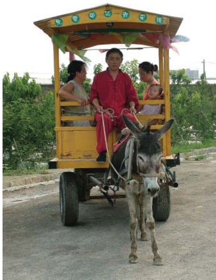
蟹島休閒農場－運用傳統驢車來載送遊客

北京市是中國的首都，也是全國政治、經濟、交通和科學文化中心，更是中國歷史最悠久的城市和古都之一。由於經濟快速成長，人們的工作壓力也愈來愈大，於是需要有更多的休閒場地來提供人民紓解壓力，因此北京政府當局近年來積極發展觀光農業，一方面做為城市居民休閒度假的去處，另一方面可以增加農民收入。而這正是我們此行的主要目的，也就