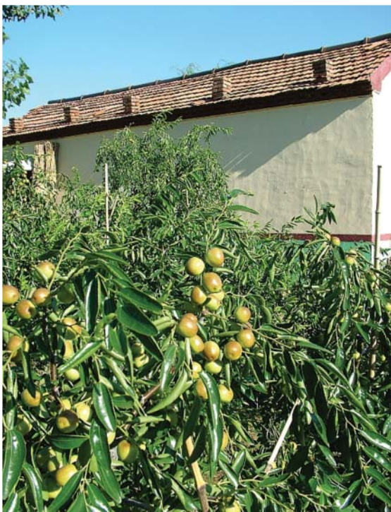
黃河鄉無公害生態農業園區——結實累累的蜜棗

總產值的比重達到 51.7%，高效經濟作物占農作物播種面積的比重達到50%，進入產業化體系農戶的比重達到51.3%。因爲當地考察重點以農企業與港埠爲主，雖然較少接觸到農業據點，不過車程沿途看到的是東北地區的麥田、玉米田輪作的典型農村景象，可以實際感受的大陸的農村社會