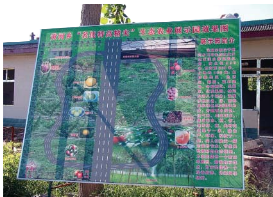
黃河鄉正在規劃中的無公害生態農業園區