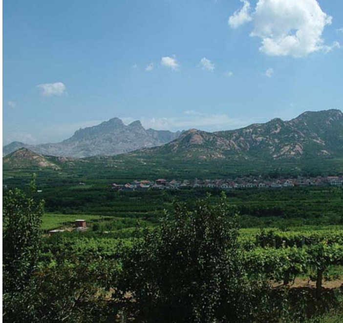
「中國葡萄之鄉」大澤山鎮——一望無際的葡萄園有如世外桃源

同時天津也一直是華北地區菜蔬、畜產品、水產品等名、特、優、新農產品重要生產基地，2002年後養殖業和優質高效種植業成爲農業經濟主體，養殖業占農業