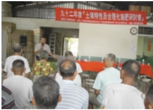
章課長主持92年度「土壤特性及合理化施肥研討會」