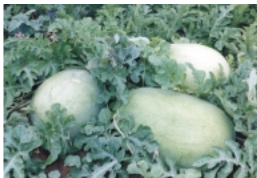
後龍鎮所產西瓜，水分充足，甜度適中

西瓜雖然對土壤的選擇並不嚴格，以排水良好、土層深厚、有機質多，土質鬆厚的砂質壤土為佳。以往農友為了增加產量，多施氮肥，長期不當的施用化學肥料，造成土壤有機質含量普遍不足且呈強酸性，也導致氮、磷、鉀不均衡及鎂、鈣等元素缺乏，影響植株生育，西瓜果實品質不佳。