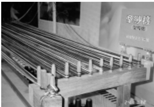
三、四十年代手工牽紗機