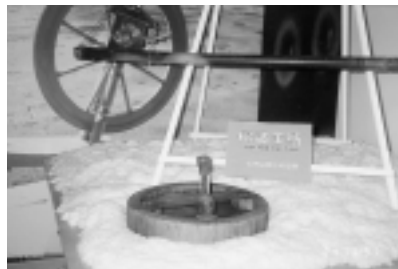
四十年代的棉被工紡