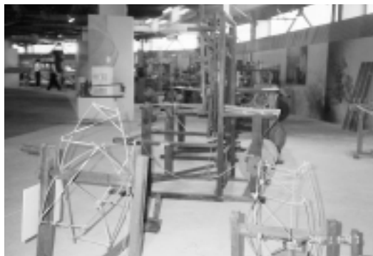
三、四十年代手工紡織機