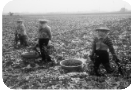
彎累了，站起來歇一歇