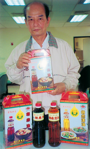
善化鎮的胡麻油及胡麻清油 (圖中人物為農會推廣股王股長)