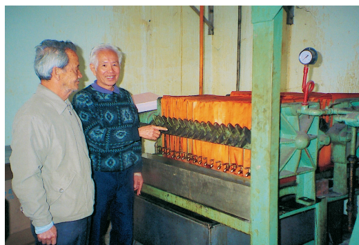
現代式的榨油機以電力控制

胡麻為一年生草本植物，莖直立、四稜形、單葉對生，花為白色或參雜有淡紫紅色或黃色，蒴果四稜，種子小而量多、呈卵形、先端微突尖、有黑色與白色兩種。胡麻以主要用途是種子供為榨油、製糕餅或芝麻醬等，榨油用的胡麻籽以黑色的為