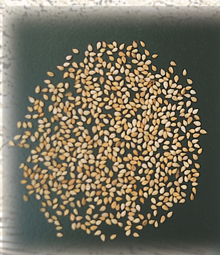
胡麻種子有黑白之分

善化鎮農會自設有胡麻榨油工廠，為保證品質，農會訂定保證價格向農民收購自產的胡麻，一級品每台斤70元，二級品65元。胡麻油是由黑色的種子提煉而成，香濃可口，含不飽和脂肪酸及豐富的維他命E、礦物元素外，尚含多種特殊具有保健功效之物質，為烹飪料理最佳用油，是滋養補品，可預防白髮、抗氧化、防止衰老；亦可溶化膽固醇、防止血管硬化；屬高纖食品，具有整腸、消炎等功效。台灣胡麻栽培面積不多，收穫量尚不敷國內所需，仍需從國外進口，雖然省產胡麻籽品質較好，榨油率較高，但仍擋不住進口競爭的壓力，或許是因人工等生產成本太高吧！