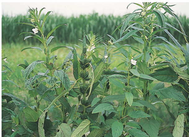
胡麻開白花，結蒴果

→ 善 化鎮位居台南縣的中央與官田、麻豆、安定、新市等鄉鎮毗鄰，屬嘉南平原，地勢平坦，有縱貫鐵路經過，交通非常便利。據「南瀛風采」誌記載，善化鎮在荷據時代叫「目加溜灣社」，日據時代改為「台南縣灣裡辦務署」，光復後才訂名為善化。善化有「人文至善，化育台灣」之意。據考，3百多年前有位先生名叫沈光遠，號稱斯庵，因遇颱風漂流至台灣而在善化一帶教書、行醫，啓迪善化子民，桃李遍佈，後人尊稱為「台灣孔子」，並立碑緬懷追念。善化並無特殊觀光景點，比較有名氣的是「亞洲蔬菜研發中心」及全台規模最大的「牛墟」，牛墟是台灣早期農業社會農耕牛交易市集場所，於今雖已因時代的變遷而沒落，然因其具有傳統之特色，有關單位仍極力維護保留，但內容大不相同。善化鎮鄰近雖