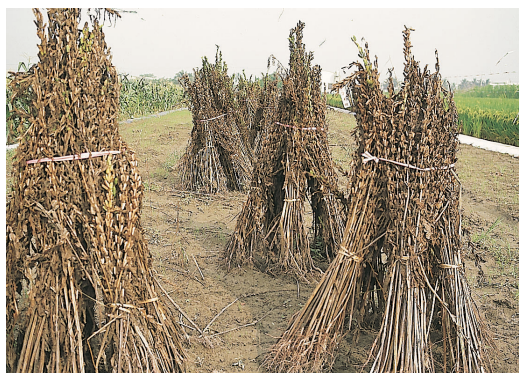
數網交叉豎立在一起曝曬

期時，氣溫回升，植株生長旺盛，需摘心以減少養分耗損，採收時常逢下雨，不利收成；秋作播種適期為8月下旬至9月中旬，這段期間尚有下列雨，可促進植株生長，開花期氣溫暖和，有利於結蒴果，後期日照漸短，可使胡麻自然收花，成熟時氣候乾燥，便於收穫，品質較好。