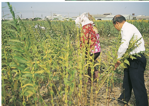
◀ 胡麻葉黃化時即可採收，採收連根拔起