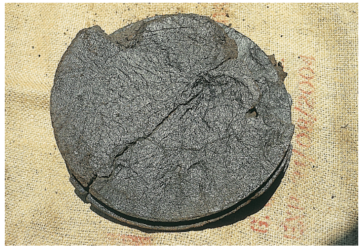
壓榨後之胡麻粕可當為有機肥材料

胡麻油簡稱麻油，是由胡麻種子提煉而成，氣味香濃可口，為烹飪之上品。據調查，台灣每年需胡麻約3萬多公噸，其中省產胡麻僅佔2%，大部份來自國外。省產胡麻種子含油量較高，香濃味美，國人較為喜愛。善化鎮農會為保證品質，自設榨油工廠，