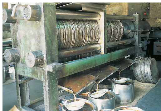
老式的胡麻油壓榨機

胡麻栽培雖較粗放，但也需注意肥培管理，除於播種前施用基肥外，於植株生育期及開花結果期均應施追肥，尤其在收花後種子開始成長時需更多的磷肥，因此，追肥是有助於產量的提高。從開花到成熟約需兩個月，成熟期到時，植株莖葉逐漸轉