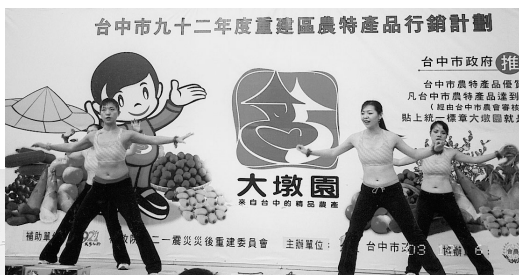
品牌行銷發表會中的娛樂節目—有氧舞蹈，熱情有勁