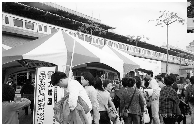
台中市的農(特)產產銷班在淡水捷運站廣場集體出擊，舉辦農產品品牌行銷展售會