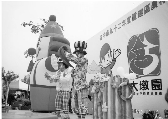
「唐老鴨與小丑」的魔術表演真逗趣