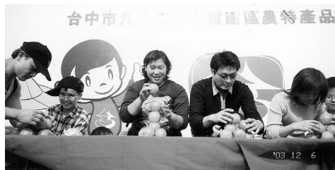
比比看，看誰誰得桔桔高