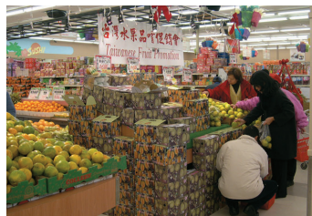
2003年溫哥華台灣冬季 水果促銷活動情形

美國市場對於農產品之防檢疫較為嚴格，我輸美蔬果需經農藥檢測及冷藏處理，因此外銷蔬果產品項目有限；另我輸往加拿大蔬果除需符合檢疫相關規定外，尚無品項限制，為加強拓展我農產品美西及加拿大市場，農委會2003年冬季特請外貿協會結合台灣青果運銷合作社及台灣區農業合作社聯合社，配合聖誕節之採購旺季，辦理美西、溫哥華台灣冬季水果促銷活動。