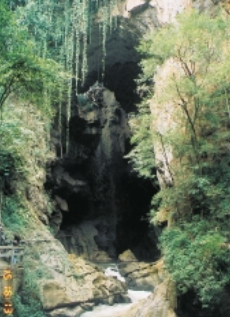
▲野野美美的烏來景色

從新店客運站步行過來，遠見吊橋懸拉的粗大鋼索穿過市街民房，近看實在怪異，有點不可置信。這一端的龐巨橋柱根部，收束為