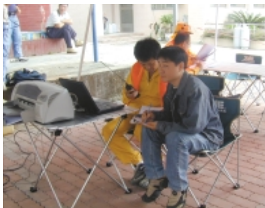
「921」大地震時，與同事利用電腦傳達資訊，以便掌握災情