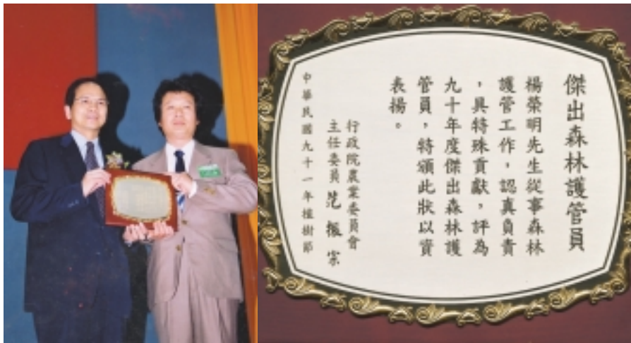
榮獲行政院游院長親自頒發獎牌，右為獎牌