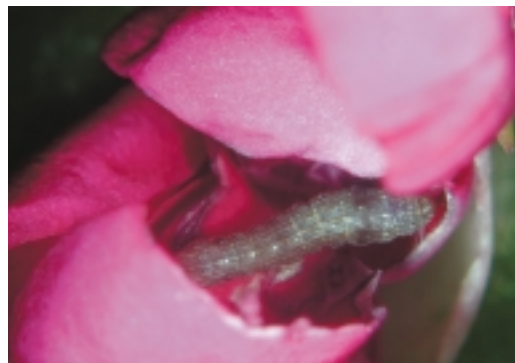
斜紋夜蛾幼蟲取食花瓣狀

菊花或康乃馨蚜蟲等推薦藥劑使用，如9.6%益達胺溶液1,500倍、24%納乃得溶液1,000倍、90%納乃得可溶性粉劑3,000倍及40.8%陶斯松乳劑1,500倍等。