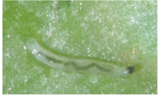
為害蘭花水苔的草蠅幼蟲