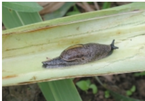
蛞蝓取食蘭花葉片