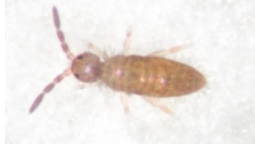
為害蘭花水苔的跳蟲