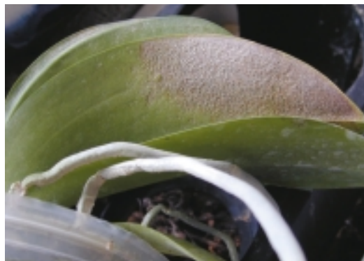
太平洋偽葉蟻為害葉片造成暗褐色斑塊

露，這是螞蟻最喜歡取食的营养品，因此本蟲常與螞蟻共生。所以防治介殼蟲時，應同時防治螞蟻。