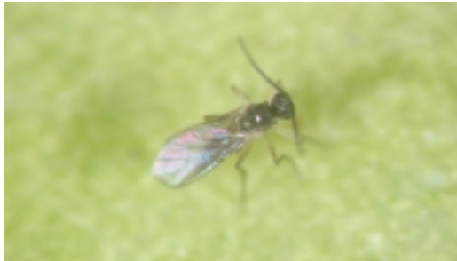
為害蘭花水苔的草蠅成蟲