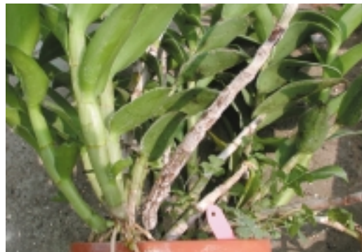
椰子盾介殼蟲為害狀