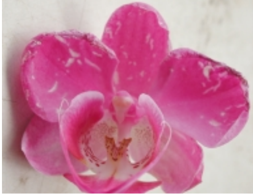
薊馬為害花朵，形成白色斑點