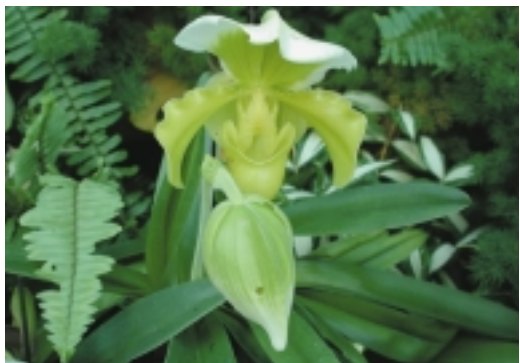
鱗翅目幼蟲為害狀