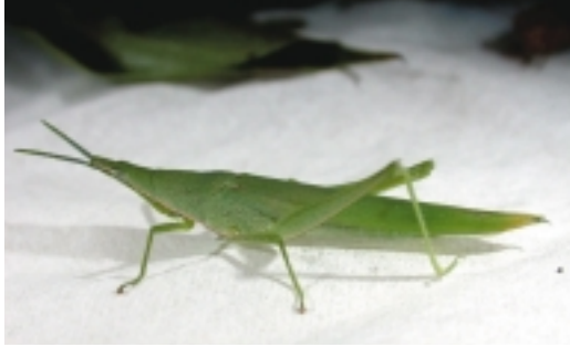
蝗蟲多由由網室隙縫或溫室門窗飛入蘭園