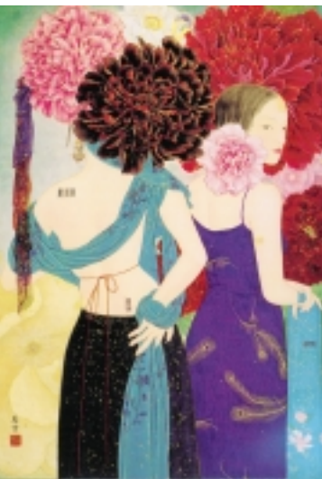
聶蕙雲畫作《歡迎光臨》

手工造紙歷史悠久，從古至今，有各種名紙出現，但隨著手工造紙的技術逐漸失傳，歷代名紙也逐漸失去蹤跡。為了使古代著名的手工紙再現，行政院農業委員會林業試驗所特別