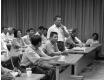
與會農友針對梨新品種「台中1號」充滿好奇，紛紛提出問題請教

特性及栽培方法，並帶領大家前往梨園參觀且進行討論，與會農友對此一梨新品種，充滿了好奇與強烈的栽種意願，除了針對其特性栽培方法及病蟲害防治問題，並有多人詢問如何購得此新品種。