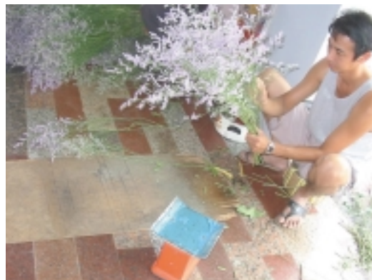
卡斯比亞分級處理

場需求，彈性調整切花種類的栽種比例；除此之外，農場的工作皆由自家人負責，從種植到分級，節省不少的人事費用。