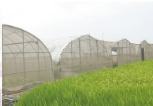
阡陌間的簡易溫室