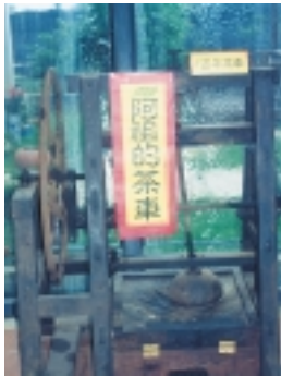
百年的「阿祖的茶車」