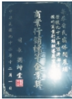
榮獲經濟部商業行銷 標竿企業獎獎牌