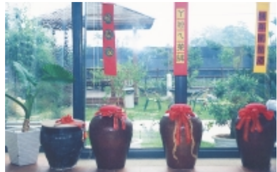
走廊上的農家古甕