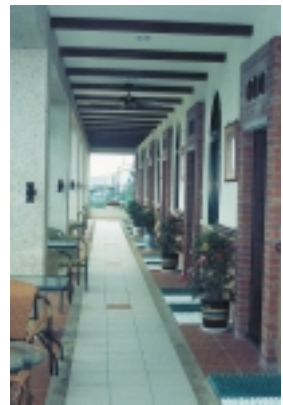
二樓客房雅緻的走廊 景觀