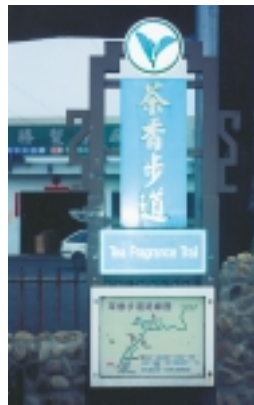
觀光局豎立的「茶香步 道」示意牌