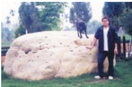
場內庭園中十分罕見的重逾40公噸的巨無霸凱石