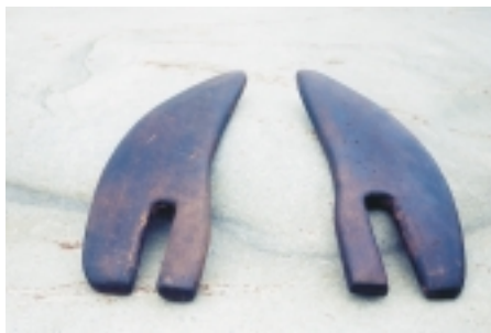
百年歷史的阿祖的茶焙

茶米香休閒農場位在松嶺觀光景點——「茶香步道」入口處右側的民宿是一棟二樓高，座落於綠油油草坪上的L型歐風融合閩南式建築，有花叢圍繞的木造亭台，紅凱石聳立的雄偉，流水亭園造景，呈現剛柔並濟的美感。二樓則是雅緻客房，空間分層使用是最貼心的設計。樓下右側闢為茶道與咖啡座，左間是餐廳、會議室。室內、通廊的空間分別陳設有「阿祖的茶車」、風鼓、酒甕…等早期農村古文物，牆壁上懸掛著名畫，畫家