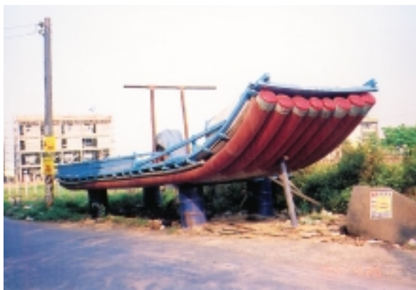
停泊在陸地的塑膠筏