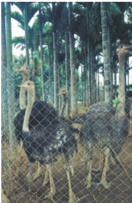
農場檳榔樹下飼養的非洲駝鳥

農場內不但收藏有奇形怪狀的濁水溪巨大岩石，周邊更有繁多的植物生長，堪稱生物界大觀園，寓教於山色的綠色天堂。在茶園一隅的檳榔林下養有6隻非洲大駝鳥，農場裡還飼養外觀亮麗的日本竹雞、台灣銀雞，最近飼育純台灣土種山羊。這裡有岩石、動物、鳥類以及昆蟲，植物的豐富資源，可免費提供絕佳的戶外教學場所，讓親子渡