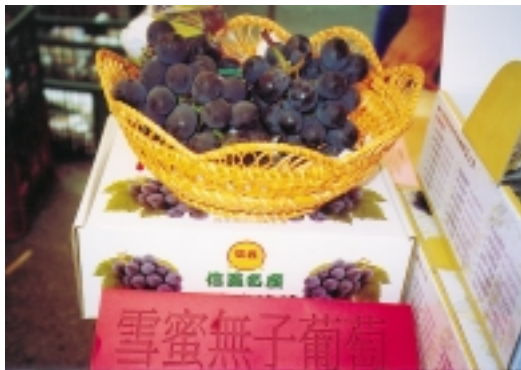
「雪蜜」無籽葡萄，粒大，甜度高，成為受歡迎的外銷產品

賓跟會眾參觀「田媽媽地方料理」園遊會，「田媽媽」是農委會利用農業資源與婦女技藝才能而成立的創業經營班，他們以經營田園料理及傳統米食餐點為主