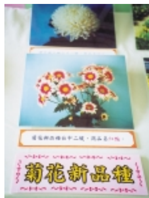
台中區農業改良場育成的菊花新品種「陽光」與「紅豔」

另外，新育成菊花新品種「台中1號」——陽光，「台中2號」——紅豔，菊花優良新品系97303與菊花紅美人，為菊花增添異彩。