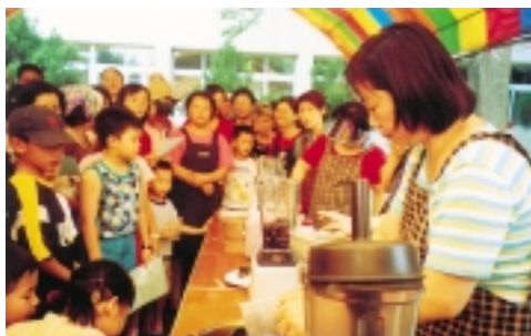
台中區農業改良場家政組人員新開發的葡萄冰沙——香、甜、涼一夏又富營養