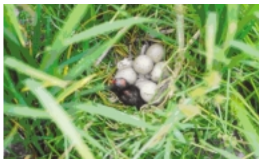
有機栽培可以讓環境生意盎然

有機農業嚴禁施用任何化學農藥，我們可以容易的發現，因為沒有農藥的危害，所以土壤中消失已久的蚯蚓出現了，而以蚯蚓為食的青蛙也跟著出現在有機耕作田中。此外有機耕作田因為有許多小生命在此生存下來，可以當成為蜻蜓的食物，於是蜻蜓盤旋在田野上空的情景也時有所見。如此有機耕作田中的生物自然生存及繁殖，形成有規律的食物鏈及生態系，我們生活的環境再度恢復生命力，出現豐富的色彩。所以發展有機農業可以恢復土壤活性，讓土地永續