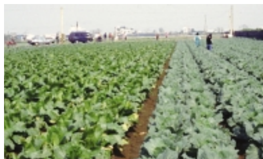
大面積集團化的有機栽培田

經營，亦可幫助環境生態復育，豐富地下水源，美化我們的生活環境，提升生活品質。然而有機農業的推動，還需更進一步的努力，國內自民國84年開始推廣作物有機栽培，至目前為止，有機栽培作物面積僅有1,092公頃，尚不及國內作物栽培面積的0.1%，大部分作物栽培仍繼續使用化學肥料及農藥。雖然作物使用有機栽培後，對環境生態復育，確實有其顯著的效果，但是如不能大面積推廣，現有的有機栽培將無法抗衡周遭因大量使用化學藥物所帶來的破壞，甚至使現有的努力幾乎化為烏有。