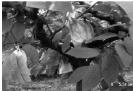
鳳梨釋迦套袋，以確保果實的品質