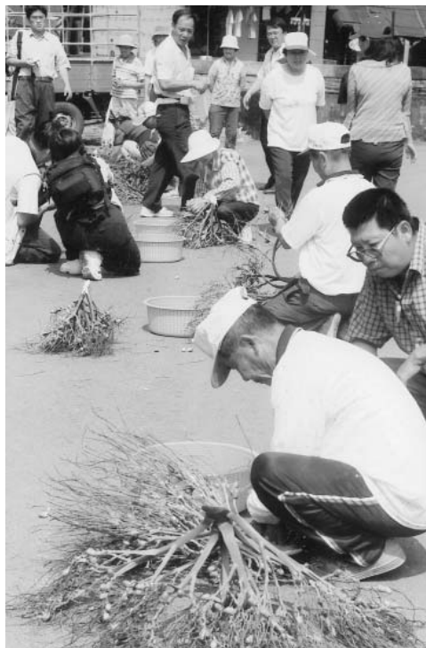
手摘檳榔比賽，笑意滿場

客家傳統米食是極具有地方特色的食品，因時代的演變，西方速食文化東進並蓬勃迅速普遍化，以致雖偶爾可見在市場兜售的傳統米食製品，其代表的歷史涵義卻已鮮少人會去深入理解；為使客家傳統文化之再傳承，喚起國人對傳統米食文化的認知，因應農業環境變化之對策，以及輔導農民學習第二專業技能，推動多樣化的米製食品，開拓農產品產銷市場，進而提高農民額外收益，發展農村經濟，提昇農民生活品質，締造農產品另一商機，麟洛鄉農會特別向行政院農業委員會南區糧食管理處申請補助辦理客家米食研習暨製作