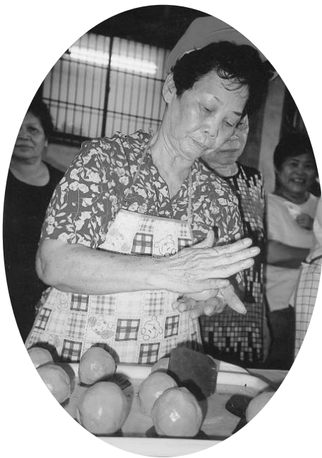
家政班員搓紅圓仔示範表演

比賽成果品嚐活動計畫，對象主要為本會農業推廣教育、農事、四健、家政班員及本鄉農民，共分6次研習時間，聘請專業老師指導學員製作炒飯、飯團、壽司等米食簡餐、紅粄（紅圓仔）、龜粄（紅龜粿）等之客家米食，及影片觀賞稻米成長的認識，並於去年底舉辦客家傳統米食研習成果比賽及品嚐活動。