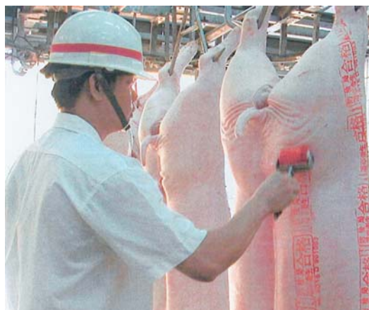
駐場獸醫師執行屠宰檢查

由於全面落實屠宰衛生管理與檢查，以維護國人食肉安全衛生係為本局當前施政要務，在政策與作法上，本局依「畜牧法」制定「屠宰場設置標準」、「屠宰作業規範」及「屠宰衛生檢查規則」等規定，建立屠宰衛生檢查體系，採取「導禁兼施」策略，對有意合法化的違法屠宰業者提供設置屠宰場必要之技術性指導，以符合我國衛生安全、人道屠宰及環保標準之屠宰場，尤其研訂「加強屠宰衛生檢查制度計畫」，以落實肉品檢查業務，提昇我國屠宰業水準，並符合國際標準及建立產業新形象；其次為強化各縣市政府查緝小組功能，對心存僥倖或不願合法經營者，加強取締，期使全部交易豬隻在合法屠宰場並經屠宰衛生檢查，以維護