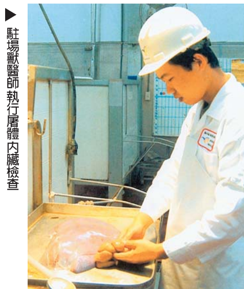
駐場獸醫師執行屠體內臟檢查

為督促屠宰場改善軟體之水準，本局研訂「家畜屠宰場設施及屠宰作業檢查程序」，依據畜牧法及「屠宰場設置標準」、「屠宰作業規範」之規定，全面展開執行家畜屠宰場設施設備及屠宰作業檢查工作，每場至少檢查設施設備2次及屠宰作業3次。針對全國各家畜屠宰場之軟硬體方面加強管理，俾各屠宰場維持良好的屠宰作業環境與管理制度，以確保肉之衛生品質。91年初執行