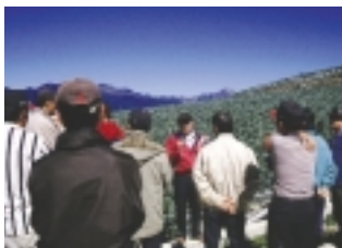
利用田間觀摩，講授正確施肥觀念