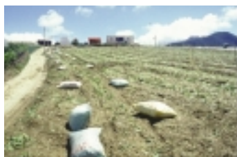
第二次整地作畦前，施用粗纖維及木質素有利甘藍苗生長