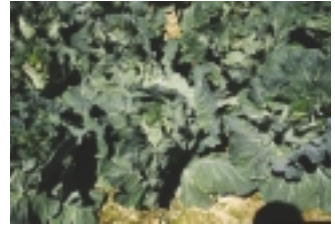
過度施用肥料使土壤鹽化嚴重

16.8% (273公斤/公頃)，磷肥減少19.8% (170公斤/公頃)，鉀肥減少14.8% (154