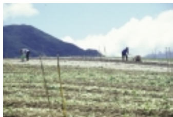
蔬菜園整地施用石灰資材，增加土壤鈣含量，減少根瘤病發生

農政單位為改善此種現況，教育宣導農友改用醱酵完全腐熟有機肥料，並以獎勵方式鼓勵農友採行合格、廉價的有機肥料，以改善環境品