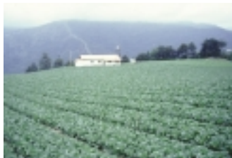
梨山地區甘藍菜園