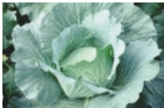
合理施肥甘藍初期結球生長

因此，建議農友施用腐熟完全富含有機成分及纖維質、木質素含量高的有機肥料，才能有效改良土壤肥力，增加土壤中有益微生物活性，分解礦化釋出養分，以提高肥料的肥效，促使甘藍作物充分吸收利用，提升甘藍產量及品質。