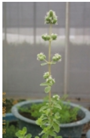
馬約蘭獨特的球狀花