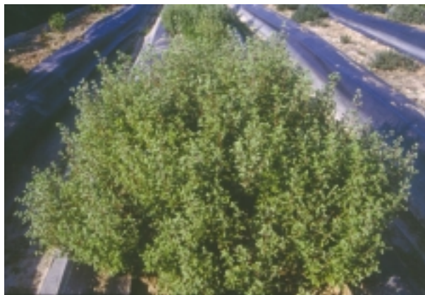
田間栽培的馬約蘭植株外觀

0.2~0.3公斤/公頃。種子重量極輕，平均約5,600粒/公克。種子萌芽適溫以25°C最佳。春季以穴盤播種育苗至株高10公分時定植田間或盆栽。晚春或秋季時節，剪取約10公分具葉片成熟之嫩枝條以沙壤土或栽培土扦插即可繁殖。根群旺盛之小苗即可定植植田間（株距約35公分）或盆栽栽培。