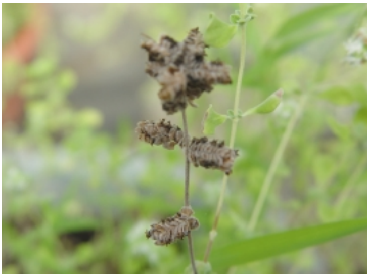
開花結實後的花序