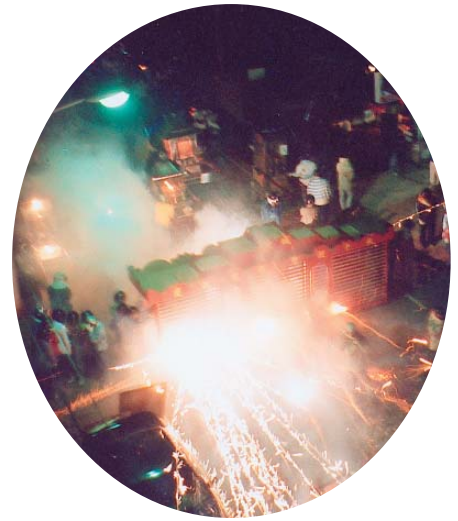
蜂炮城燃放奔射場面