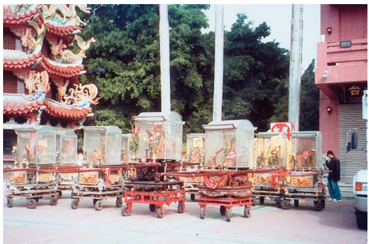
前來參加蜂炮節的各地神轎