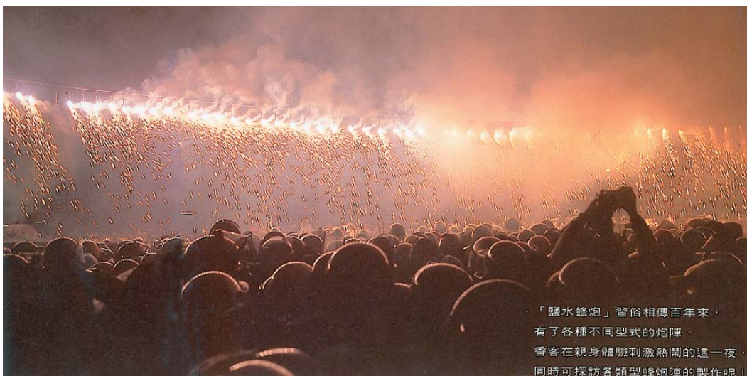
鹽水蜂炮現場巨大的煙火瀑布（卡片翻拍）

揮站，回歸隊伍一路燃放煙火、冲天炮、水鴛鴦、蜂炮，讓夜空燦爛輝煌，五彩繽紛，觀眾大喊過癮。