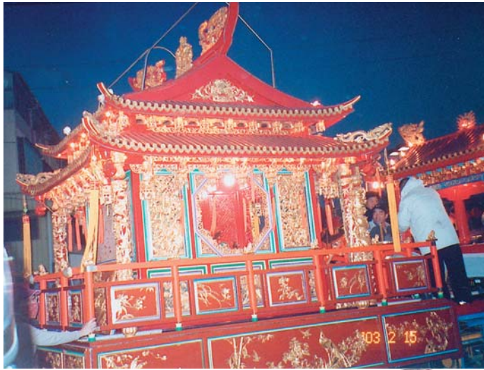
蜂炮夜出巡時關聖帝君主轎開始遊街