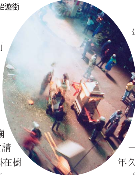
蜂炮在神轎前煙霧迷漫

年久失修，因此多次的重建整修。武廟也在清乾隆年間，嘉慶8年，道光8年，光緒元年，民國6年及60年再整修一次。