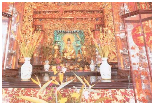
觀音菩薩神像