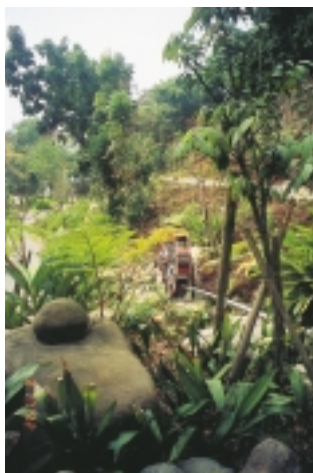
治山防洪周圍的景觀美化

目標努力，是第三工程所當前的重點課題。張所長與工作夥伴研擬了一份對策，將工作目標訂定了幾項執行方案：