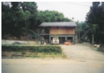
配合休閒農業的開發，此處將建造一處民間活動中心服務處

張所長表示，他自民國87年到任，到民國91年度止，第三工程所的工作經費由5.16億元增加到33.41億元，增加了6.5倍；工程件數由293件增加到1,595件，成長了5.4倍。而第三工程所的人力配置，應有56人，可是遵照控管出缺不補，今(92)年為48人，人力嚴重不足。張所長已呈報上級長官，擬准遞補不足之人力，以利執行各項水土保持建設與災區重建。至於如何突破目前困境，朝有效率及優質化