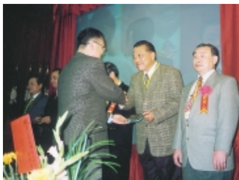
榮獲第二屆全國治山防災成果特優獎表揚

水土保持局第三工程所的前身原屬於省府山地農牧局屬下8個工作處之一，專門執行加強山坡地水土資源保育工作，到民國63年，農牧局將第一及第五工作處合併為第三工作處；到了民國78年改制為省府農林廳水土保持局第三工程所；民國88年改隸為行政院農委會水土保持局第三工程所至今。張所長指出，該所的主要