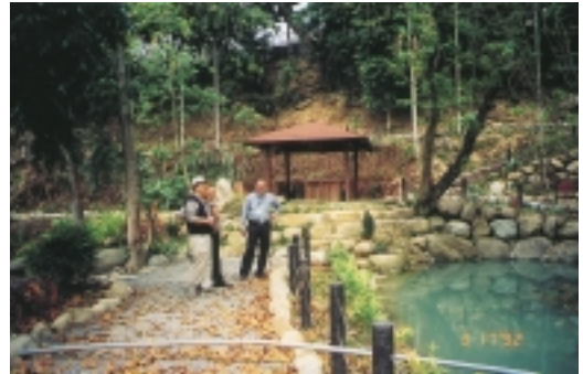
有涼亭、有池塘，彎彎小徑，讓旅者欣賞