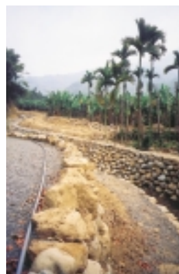
荒山野地，就是水土保持者的工作所在地