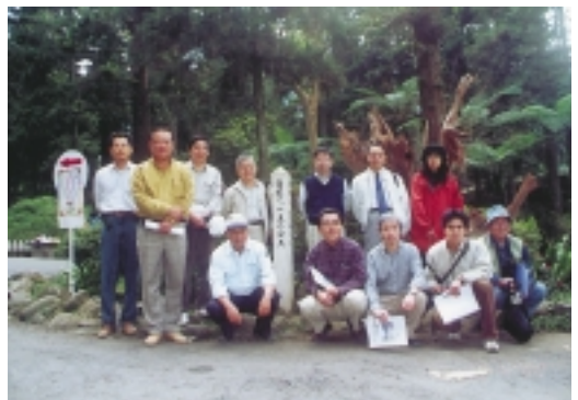
陪同國外專家視察山坡地時，中途留影