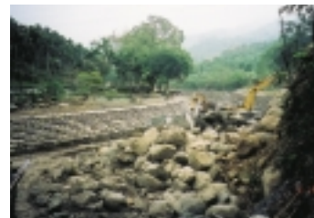
中寮鄉內城清水整治工程正在進行

張所長優秀之工作表現，使他於民國89年榮獲全國模範公務員表揚，獎金5萬元。張所長個性豪爽、交友寬廣，他告訴筆者，他用獲得的獎金宴請工作夥伴、朋友、長官、親人，大