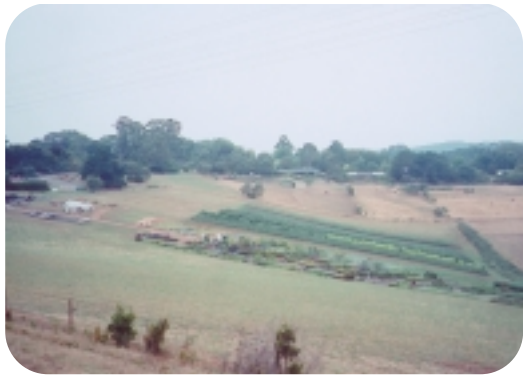
丹帝諾丘陵景色宜人，有居家有牧場

蒸氣的意思，卻也是因為小火車行進中，會發出澎澎芬芬的聲音，至於Billy則是早期澳洲人對小鐵桶的通稱～如在野外時用小鐵桶煮的茶就叫比利