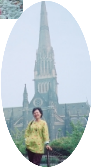
聖派翠克教堂，其歌德式建築青石，是從英國運來的喔