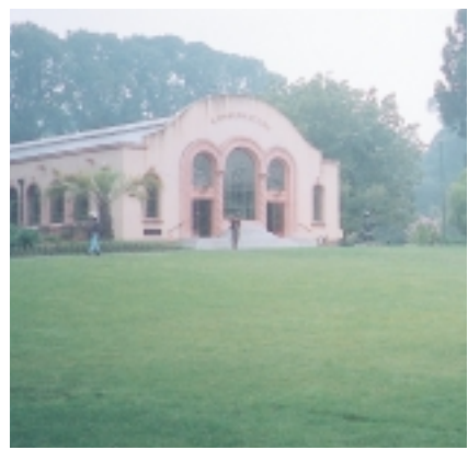
溫室花房在費茲諾公園內（屋前有戴安娜戰神，象徵美麗與智慧）