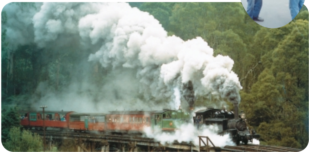
蒸氣古董火車，離墨爾本市區約50公里（卡片翻拍）

我們下午要搭的蒸氣古董火車，是在離墨爾本市區約50公里的丹帝諾丘陵，參加這個叫普芬比利的火車之旅，最起碼的收穫是懂得Puffing Billy這兩個字的意思，導遊說Puffing雖是發出