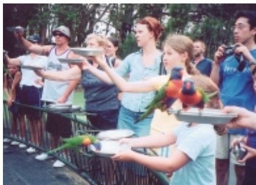
有人單手撐天，有人雙手奉承，只求野生鸚鵡賞個臉

我們到達時間是下午4點鐘，正好趕上餵食時間，只見那個籃球場般大的場地中，四週圍了道人牆，想和鸚鵡一親芳