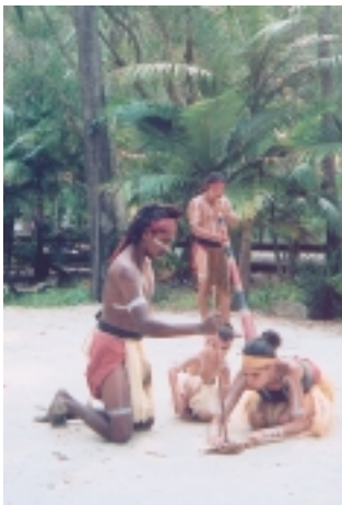
可倫濱野生保護區有澳洲原住民表演

關於夢幻世界這個澳洲迪斯尼樂園，依我看，想玩得盡興些的人，有兩種可能，一是玩高速落體、恐怖塔、夏威夷大翻轉等三大驚險遊戲，另一是抱著無尾熊