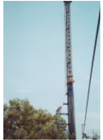
夢幻世界的高速落體、恐怖塔驚險遊戲地點，就在這高塔進行

三大驚險遊戲的高速落體、恐怖塔，其遊戲地點可說在同一高塔，這座塔高約有38層樓，遠遠看就像支煙囪。前者的遊戲方式，是人坐在一排安全椅上，然後以時速160公里速度，7秒鐘急速上升到頂端，然後雙腳懸空的在半空中停幾秒鐘，再垂直急速下降；後者則是人坐在汽車模型裡，以衝浪式弧形快速爬升，在爬到塔身半高處，再馬上循原路急速後退；至於夏威夷大翻轉，是把利用兩邊柱子扭力，把兩