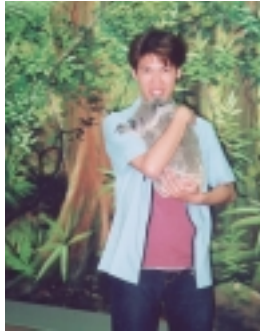
昆士蘭是澳洲東部唯一准許抱無尾熊的省份

至於澳洲東部的南威爾斯省和維多利亞省，都不准許人們抱無尾熊，那是怕疾病傳染，也怕無尾熊精神壓力