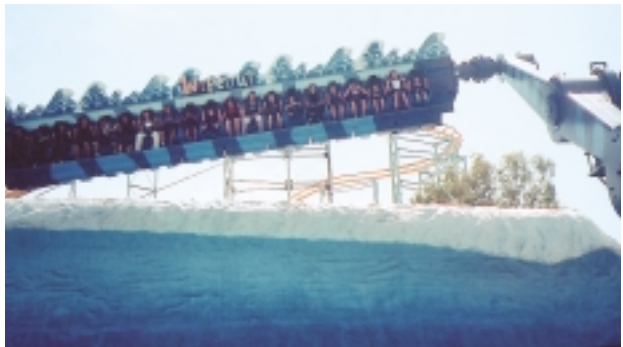
夏威夷大翻轉是把人拋在半空中，轉來轉去忽上忽下，仰看以算盤般