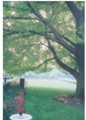
墨爾本有澳洲倫敦美譽，城市魅力無法擋

目前城市充滿異國風情，那是因為二次世界大戰後，澳洲人想加速工業化，也想增加人口，富強國力，所以就政策上歡迎移民，以致歐洲、中東、亞洲等有意移居澳洲