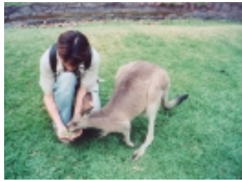
袋鼠呀，就拜託您吃一下草吧

→ 說，團員頗能理解，因為園區飼養的其他動物，似也個個養尊處優，有隻袋鼠可做典範。