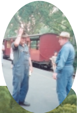
◀ 古董火車配古董工作人員

本來只是一份心意，後來聽導遊開玩笑說，在萬象更新的1月份，去到教堂，可順便把去年所做的壞事，向聖母瑪利亞告解一番，這……還真是有道理喔！只是一時想不起做過什麼壞事？