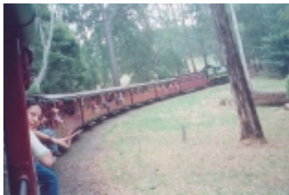
古董火車車行速度不快，可將頭手腳等伸在車外