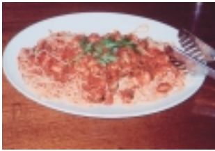
我們在TOTO'S百年老店吃的義大利麵