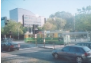
墨爾本的街上尚保留有電車