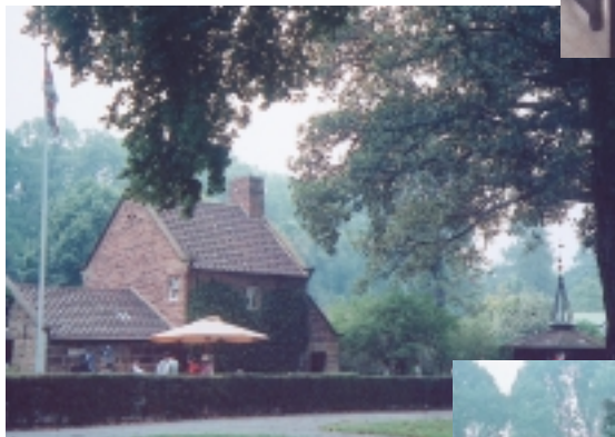
庫克船長故居原建於英國，是墨爾本被發現百週年的禮物

衷體育藝文活動的居民（如定期舉辦喜劇節、電影節、皇家農場秀、啤酒節、馬賽、網球賽等）、有多元飲食餐點……，甚至說是街上尚保留有電車，總之，城市魅