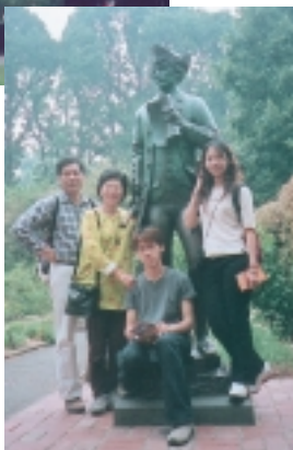
庫克船長是英國人，他在1770年時發現了澳洲

衷體育藝文活動的居民（如定期舉辦喜劇節、電影節、皇家農場秀、啤酒節、馬賽、網球賽等）、有多元飲食餐點……，甚至說是街上尚保留有電車，總之，城市魅