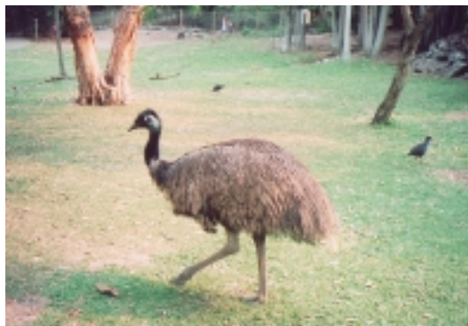
可倫濱野生保護區的食火雞，氣定神閒不慌不忙

「就我所聽說，是因為鳥園準備的飼料，口味變化不大，然後嘛，附近愛鳥的居民也在庭院提供飼料……」，經導遊這麼解