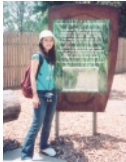
這個捐獻箱和招牌，呼籲自然生態保育，讓無尾熊生生不息

大，可能產生不孕，也許是社會輿論的壓力吧，夢幻世界經營者，在無尾熊拍照屋前廣場邊，立了個捐獻箱，上面的文字是呼籲大家要重視自然生態，讓無尾熊能在澳洲大地上，生生不息。