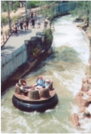
夢幻世界號稱是澳洲迪斯尼樂園