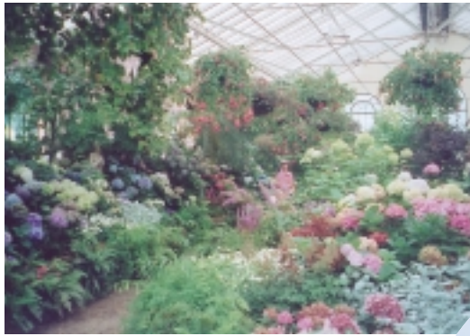
溫室花房規模不大，卻也繁花似錦