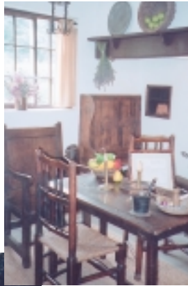
從庫克船長故居內設施，可了解18世紀英國居家佈置

在庫克船長故居旁邊還有個溫室花房，規模不大，卻也繁花似錦，尤其溫室前的戴安娜戰神，其象徵的美麗與智慧，讓欣賞者心儀十分。