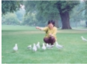
墨爾本城市中有四分之一是公園綠地