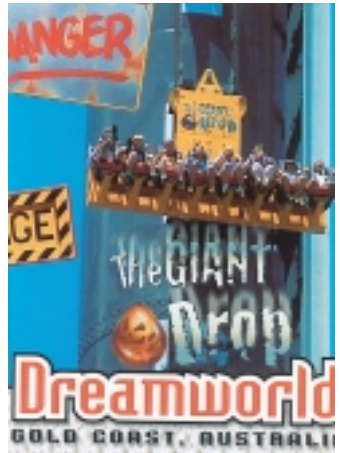
高速落體是以時速160公里速度，7秒急速上升再急速下降（卡片翻拍）