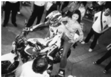
影歌星田麗小姐參加「香車美人」活動

不惜重資禮聘性感女星田麗小姐擔任本次活動代言人，農業產品也走向商業化，田麗小姐穿著蠶絲衣參加重型機車「香車美人」活動