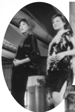
蠶絲製品名模服裝秀