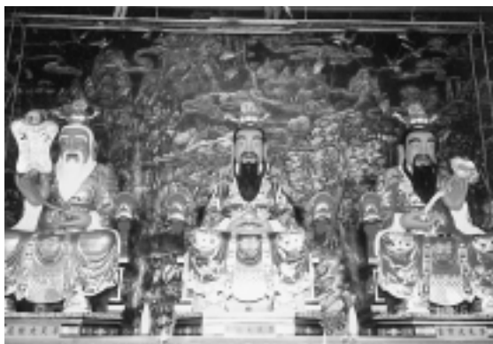
三清道祖為元始天尊、靈寶天尊及道德天尊（左至右），每尊高18.6尺，寬9尺，重2.5公噸

寺院建築為三層樓房，三清道祖殿造型仿北京紫禁城，宏偉壯觀，氣勢磅礴，建築面積2,500坪，廟面寬度110公