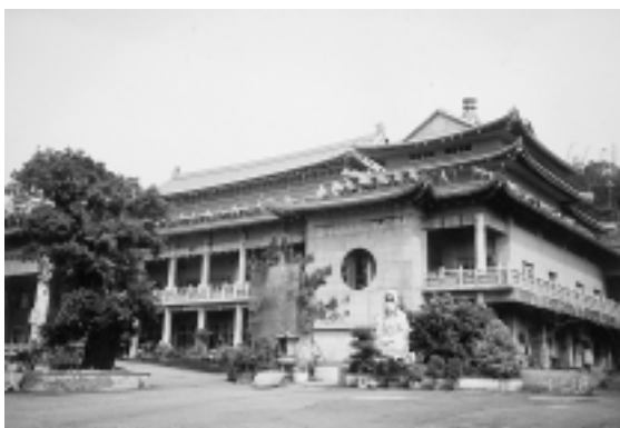
中原紫雲禪寺外觀全貌