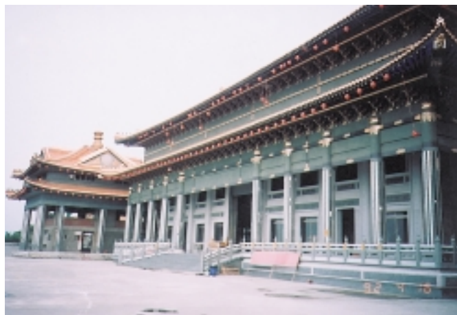
三清道祖殿宇一角（外觀）