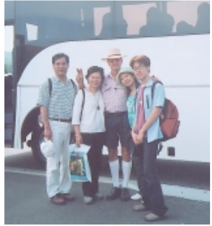
造訪藍山國家公園，搭巴士是一定要的啦（右三為澳洲司機）