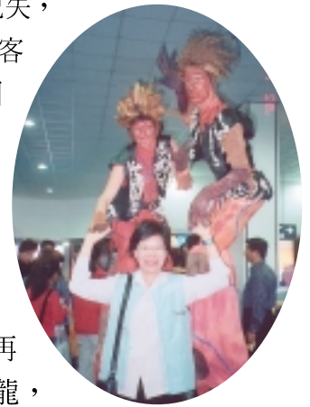
藍山的寶藏，是存在人們心目中對夢想的堅持

「安啦！……」，導遊說鐵路設計時，爲保護礦工，已裝有滑輪攬線，再則目前已改爲遊樂設施，安全已有萬全