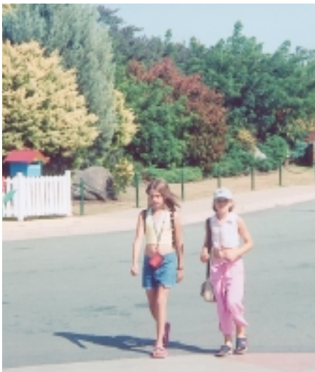
藍山在1813年時，由羅森、布雷斯蘭率遠征隊越過，當時是大牧場

一個洞穴中，巫師見到洞穴如見救星，就慌慌忙忙躡進洞裡，魔王身軀高大，無法續追，就垂頭喪氣走回家，等天色暗下來，巫師鬆口氣走出洞來，可是再