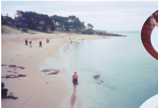
菲力普島的一處海灘，岸上樹木棵棵似中國盆景

再拜託的事，他說～我帶團10年了，每次來到這裡，就發現人類比企鵝苦命，企鵝都回家了，我們ㄉㄟ，還得坐2小時的車，才能回到墨爾本市區的旅館せ，再說ㄚ，往回走的人行步道旁，通常可以更清楚的看到企鵝的啦……。