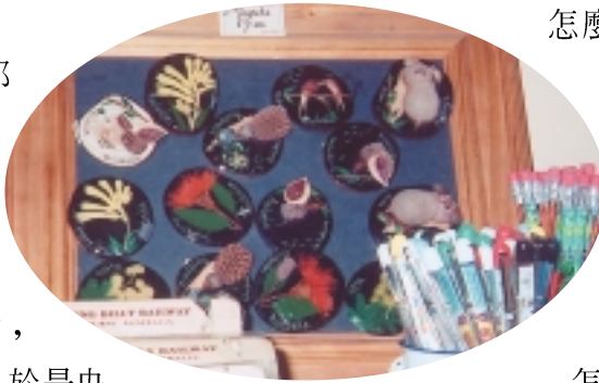
讓人眼睛為之一亮的手工藝品

故事是這樣，那就是很久很久以前，這裡有個家庭，其擁有的三個女兒非常美麗，有位巨人魔王想娶她們，可是三姐妹不喜歡，於是央求巫師變成岩石，當魔王知道這