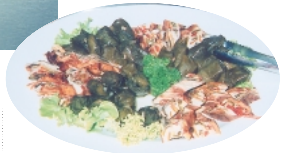
人類總是靠山吃山，靠海吃海

就想～ㄉ，牠那藍色背部是爲了讓老鷹從天上看，以爲在海中覓食的牠是海水？然後嘛，白色腹部是讓鯊魚從海底仰望，也錯把牠當海水？ㄣ……有腦筋有智慧，起碼是色彩判斷正確，有上過美術課。