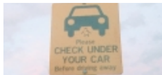
愛護神仙企鵝的方法之一，就是車子啓動前也要看車底