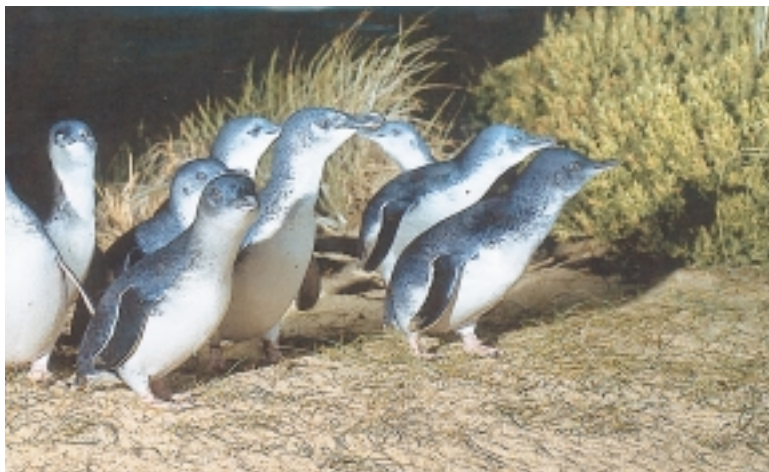
神仙企鵝的腹白背藍是保護色，成鵝不過30公分