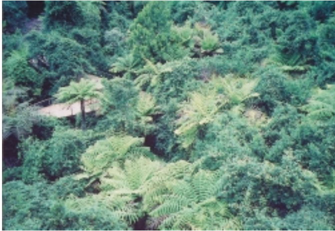
從礦山鐵路停車處，鳥瞰的部份景色