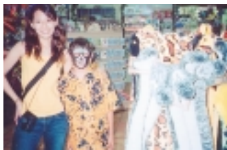
從雪梨到藍山，景色算不得多美，卻也小城故事多

齣把戲後，非常生氣，就去找巫師算帳，巫師也怕魔王，所以魔王追他時，他就跑，跑呀跑的，跑到