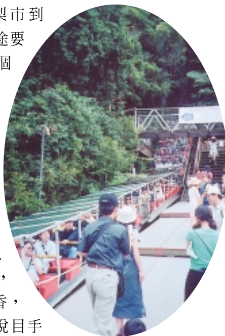
礦山鐵路最陡處有50多度傾斜

從雪梨市到藍山，沿途要經過十幾個大小城鎮，景色算不得多美，卻有小城故事多風情，如有個城市叫卡圖巴，只有一條街，充滿咖啡香，也有賞心悅目手工藝品，年旅客量就有300多萬人次。