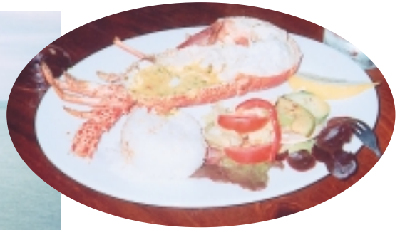
造訪菲力普島，總要嚐一下龍蝦餐

神仙企鵝小小隻的，成鵝不過30公分而已，可是牠的祖先可有智慧喔，在導遊解釋企鵝背藍腹白是保護色時，我