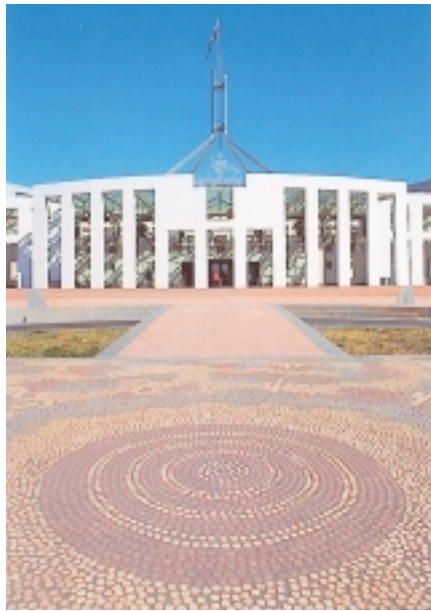
國會大廈前馬賽克拼圖，象徵土著文化悠久（卡片翻拍）