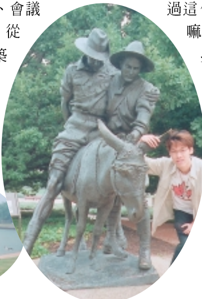
戰爭紀念館旁的一個生動雕像

（踐踏）的草皮，是讓屋頂下開會的議員們知道頭頂上處處有總統的頭家。至於有道牆掛滿歷任女性議員照片，那可是告訴世人～澳洲是世界第二個有女性參政的國家。