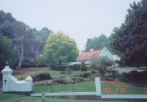
坎培拉的使節館區，各展建築風情