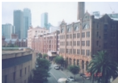
岩石區是澳洲近代史起源地（古老建築原為碼頭倉庫）