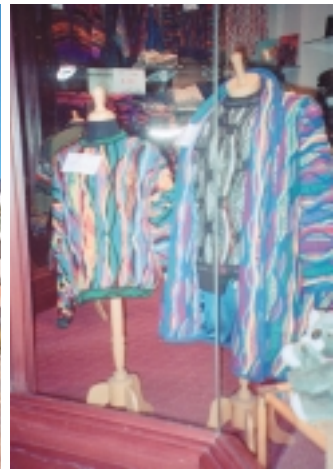
這種毛衣圖案，和國會大廈懸掛之羊毛壁毯相似