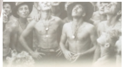
二次世界大戰時，澳洲軍人曾支援盟軍（卡片翻拍）

如果您是初訪澳洲，請不要錯過這個都市，畢竟它是首都嘛，到了這裡，除參觀那些個建築物或爬上安斯列山鳥瞰城市等，巴士往返於公路沿途所見的那塊黃瘦平原，可是荒涼中見禪意。 →