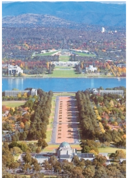
從安斯列山鳥瞰坎培拉首都(卡片翻拍)