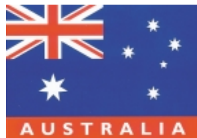
澳洲位於南半球，國旗右下是南十字星座（卡片翻拍）

所以岩石區是澳洲近代史的起源地，這個起源地，在1787年菲利普船長押解罪犯到澳洲後，慢慢的營造出雪梨這個都市。🐶