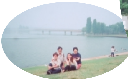
葛利芬湖是紀念都市設計師