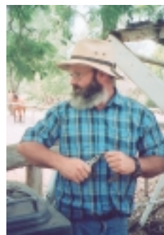
澳洲人口中，5人中有一人出生於澳洲領域外

1788年英總督亞瑟菲利普，率船員押700多名罪犯登陸，爾後陸續把犯人送過來；1828年澳洲第一次人口普查時，有