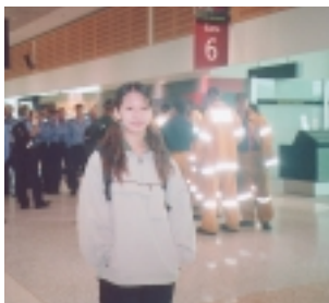
打火英雄，何嘗不是澳洲奮鬥精神再生（穿黃制服者，拍於機場）