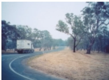
路旁枯黑樹幹是上次火災痕跡

我們在墨爾本機場、坎培拉旅館等，都有見到穿著黃色制服的打火英雄，穿著制服的他們，個個英姿煥發，這讓我想起「鱷魚先生」(Crocodile Dundee)，這是一部電影，1986年由保羅霍根主演，原為工人的他，成為澳洲