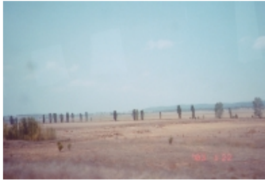
往返坎培拉的公路風景，荒涼中自有禪意