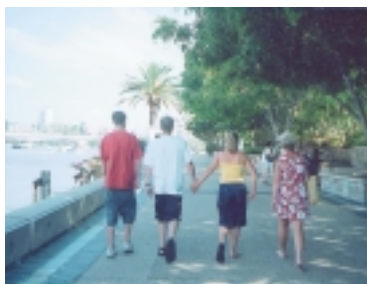
澳洲國家，說古老也古老，說年輕也年輕