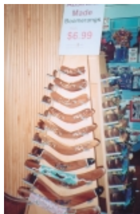
土著狩獵用迴力鏢，訴說五萬年前澳洲已有人跡

3.6萬人是罪犯和移民；1840年終止罪犯送到澳洲；1900年六個州組聯邦政府，當時戶口普查，總人口是380萬；1945~1965年政府積極鼓勵移民，但堅持白澳政策，歐洲之義大利、荷蘭、波蘭、德國等國移民居多，1970年才開放給亞洲國家。