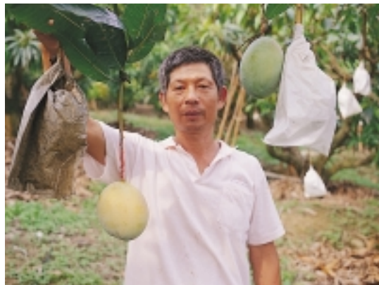
不同顏色的套袋會影響芒果果實的外觀、著色