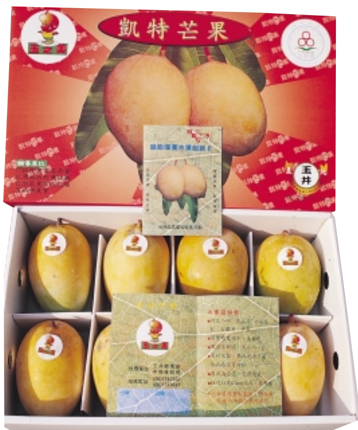
果皮綠色是玉井凱特芒果之特色

凱特芒果是晚熟品種，當愛文、金煌等銷售接近尾聲時，它一枝獨秀，獨領風騷。但其品質與套袋有關，玉井鄉的果農採用白色紙套袋，果實外觀雖較不亮麗、果皮仍保持綠色，但甜度夠，口味佳。為能普遍獲得消費者的認同，農會等有關單位已積極協助促銷，以拓展市場。