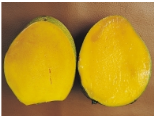
果皮綠色，果肉金黃色，甜度夠、口感佳

地生根”的品種有愛文、凱特、海頓等，這些外來種之中以愛文最“竄紅”，目前全省之栽培面積已達8千多公頃，凱特約1千公頃，海頓約700多公頃。改良種芒果目前最具代表性的品種是金煌，種植面積已達3千多公頃；台農1號僅100多公頃；其他有最近民間自己育出的品種，如「金興」、「玉文」等。