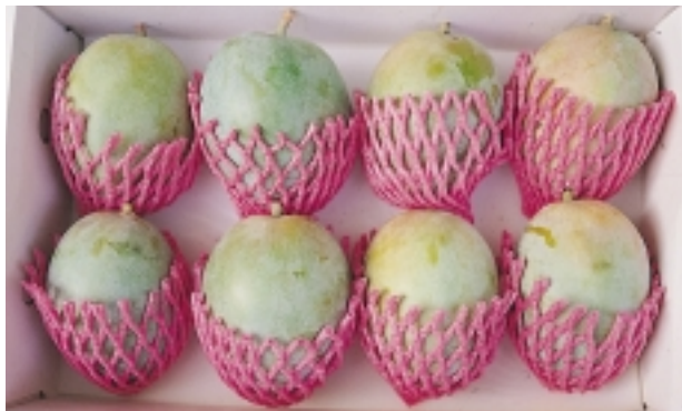
「玉之美」是玉井鄉芒果的品牌