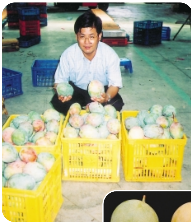
總幹事為綠皮凱特芒果促銷