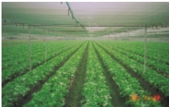
為提高蔬菜品質，農友大都採網室或簡易設施栽培