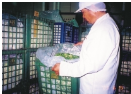
莊理事主席檢視經CAS處理之成品截切蔬菜