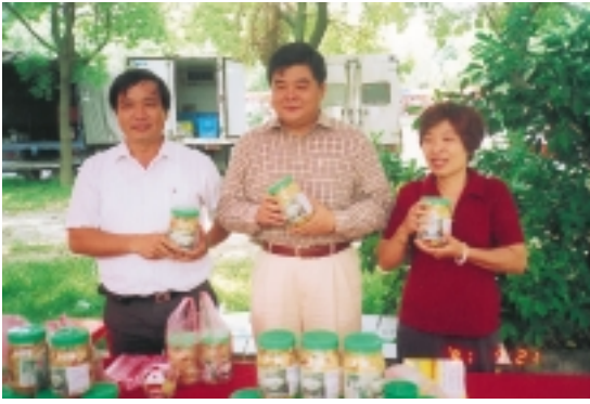
為疏解生產過剩之高麗菜、大白菜而研製各種口味泡菜上市

出貨量至營養午餐、大銷費戶、公司行號以及行口等合計1,297,918公斤，銷售金額合計17,390,284元。莊理事主席說：目前CAS蔬菜的售價並沒有提高，主因是為順應市場需求、穩固高品質農產品形像，進而提昇競爭力。因此以