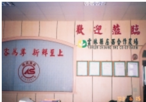
庄西合作農場「以客為尊 新鮮至上」的CAS認證

民國86年在農政單位輔導下庄西合作農場開始經營現代化蔬果截切業務，並再度投資設置1,200坪的廠房，從事蔬菜處理包裝、冷藏及配送作業，且引進截切一貫化作業機械，以降低人力資源，達到事半功倍的效能。所截切蔬菜品項為小白菜、青江菜、菠菜、包心白菜、高麗菜等，另外有根莖、花果類。主要供應北、中、南部的學生營養午餐、餐盒公司、伙食團、全省空廚以及各大醫院等團膳，年銷量超過2,000公噸以上。