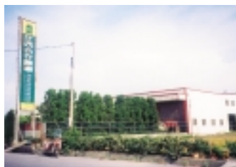
蔬果包裝處理場外景一角

為確保品質鮮度及營養不流，最後的截切至完成一貫化作業流程，必須爭取時效，要快速且衛生安全，只有在低溫處理空間內進行才能達成，就連漂水、消洗的水溫也全控制在4°C至2°C之間，才能保持最佳品質，由此可見CAS的優良產品得來不易。92年元月至5月間CAS產品