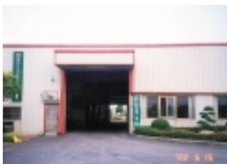
CAS產品調理場外景一角