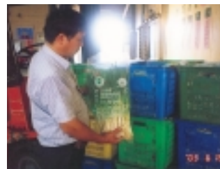
合作農場辦理吉園圃蔬果運銷產品之一