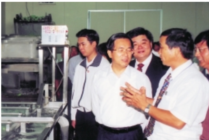
陳水扁總統前往參觀CAS產品

季的大宗蔬菜（高麗菜、結球萵苣等）也透過策略聯盟組織力量行銷至新加坡、香港、韓國、日本、美國、加拿大等國家，賺取外匯並疏解國內冬季蔬菜生產過剩的壓力。其次是利用多餘的高麗菜及大白菜加工研製美味可口的各式泡菜，供銷大都會地區，也不失為解決蔬菜過剩之道。