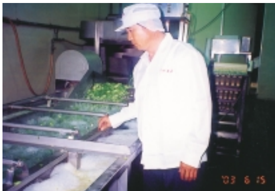
以4°C至2°C底溫，迴旋水流翻轉清洗蔬菜，營養素不流失