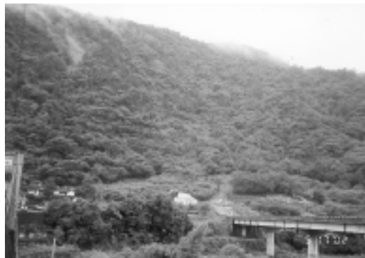
青山常在—橫山原野

台灣地處亞熱帶，高溫多濕，同一塊田複種指數又高，所以農藥使用量為世界之冠，加上國人買菜或水果，又“以貌取菜或以貌選果”這都是錯誤的