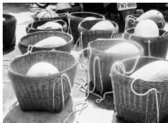
古早人就是用這種特製果籃挑西瓜