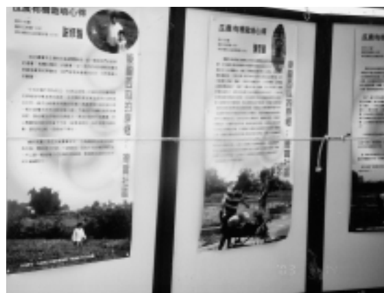
西瓜產業文化看板展示