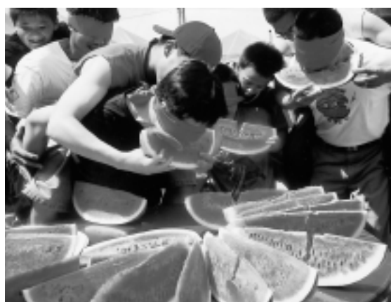
矇眼揹負一人競走又吃西瓜，趣味十足