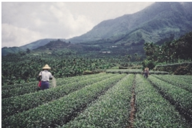
茶園合理化施肥可提昇茶葉競爭力

肥料是人類生存所需的寶貴資源，它需要被循環利用，特別是鉀與磷是開採礦石而來，有一天會完全用光，所以透過有機質肥料的方式來重複