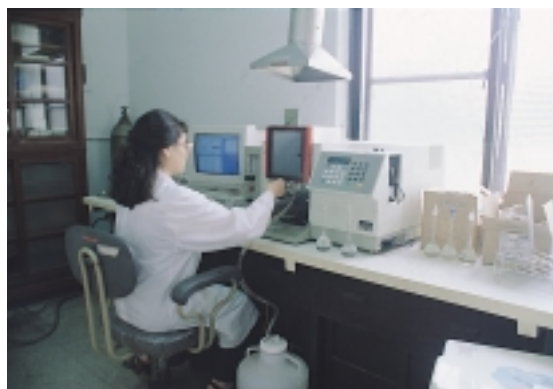
原子吸收光譜儀合理化施肥好幫手