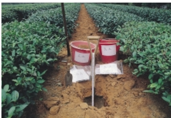
土壤取樣須依標準方法進行