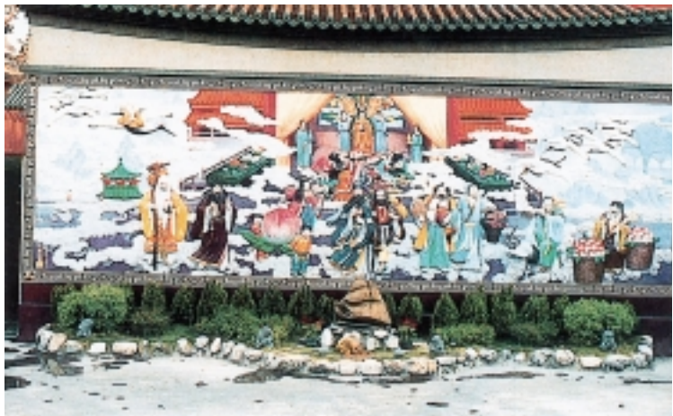
鎮南宮後牆上的八仙圖騰

民國79年，鎮南宮改選的第5屆董監事會交接後，呂洞賓仙祖諭示，特賜要興建斗姥辰宮及靈霄寶殿，需要龐大