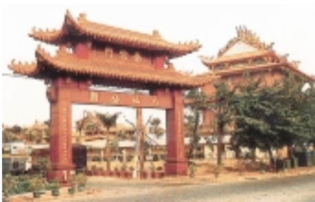
鳳山鎮南宮中的八仙公園歡迎門

→ 九龍池的九條龍，以九種不同顏色石材雕成，並按五行八卦九宮方位排列，中央主龍屬黃龍，採用浙江的黃石，高6點2公尺，長17點5公尺，龍身直徑1公尺。南方屬紅龍，以四