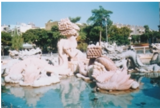
鎮南宮前五種石材雕刻的九龍池

在最早的月眉池地方，後來改為錦鯉池，養著一大群放生錦鯉魚。於民國88年，規劃闢建九龍池，相中福建廈門石雕廠，委由廠方雕刻後，運回台灣安裝。