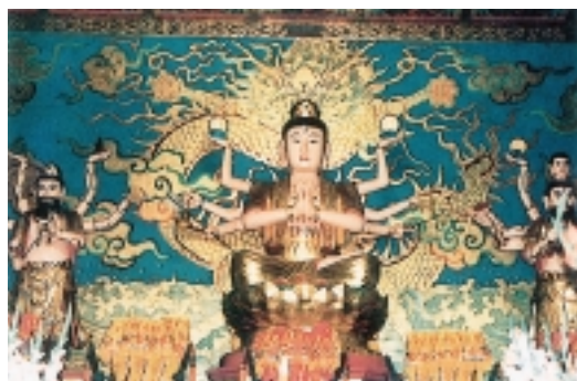
後殿二樓斗姥辰宮供祀的斗姥天尊