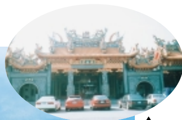
▲南部道教聖地鳳山鎮南宮