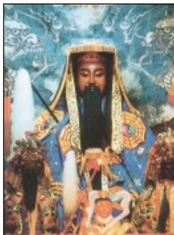
鳳山鎮南宮仙公廟主祀—呂仙祖（由鎮南宮提供）